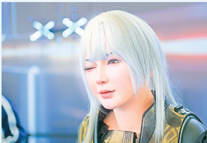
8月21日,2024世界机器人大大会现场的一款多模态情感交互机器人向观众“眨眼”。