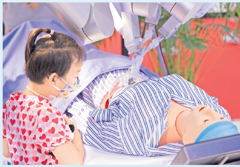
8月21日,在2024世界机器人大大会现场,参观者被手术机器人吸引。