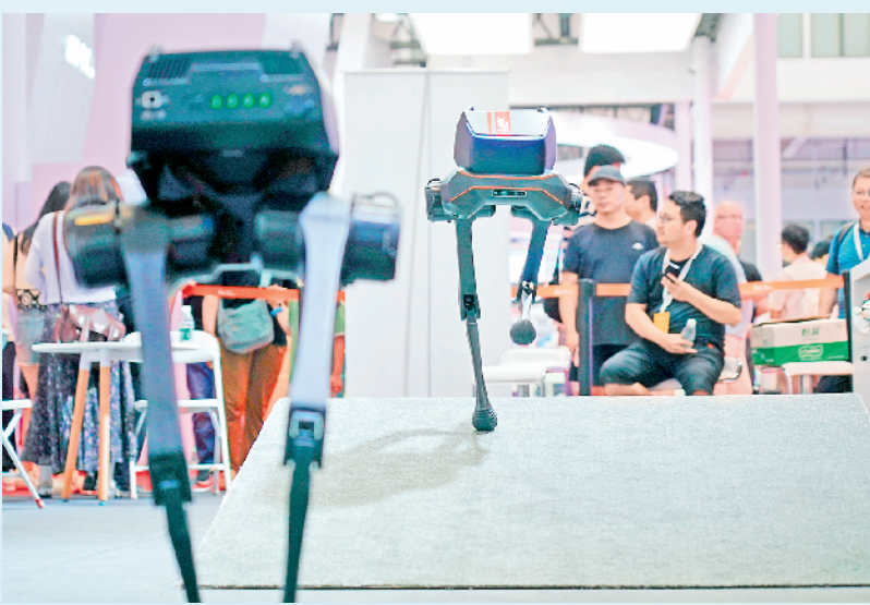
8月21日,一款两足机器人在2024世界机器人大大会现场演示。