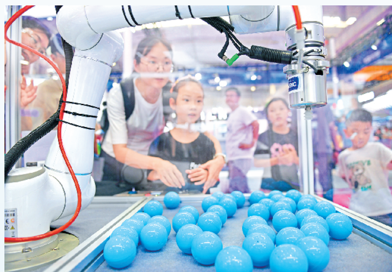
8月21日,观众在2024世界机器人大大会现场体验一款可以吸取扭蛋的机器人。当日,以“共育新质生产力 共享智能新未来”为主题的2024世界机器人大会在北京开幕,大会包含论坛、博览会、机器人竞赛等活动。