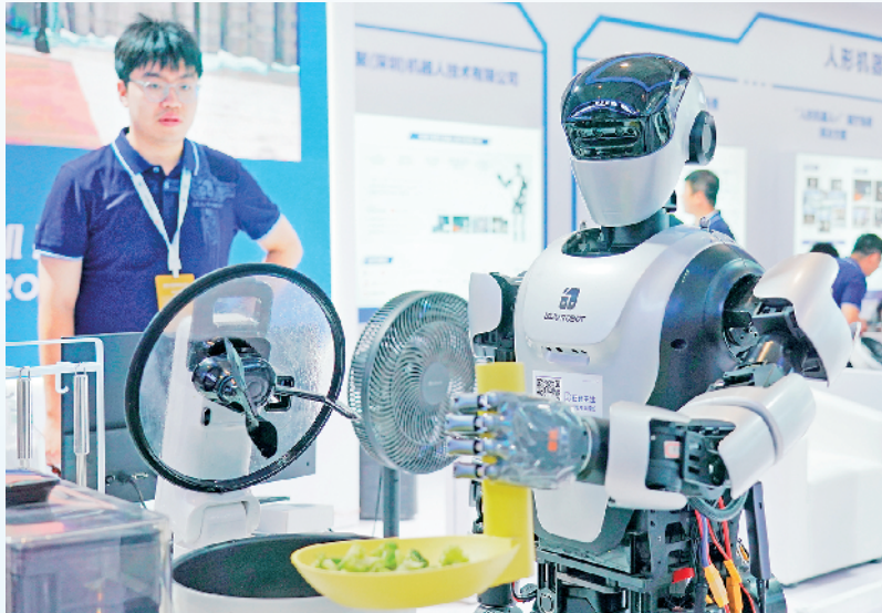
8月21日,一款人形机器人在2024世界机器人大大会展示炒菜。