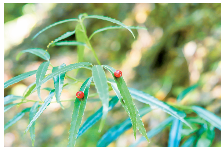
中华青荚叶