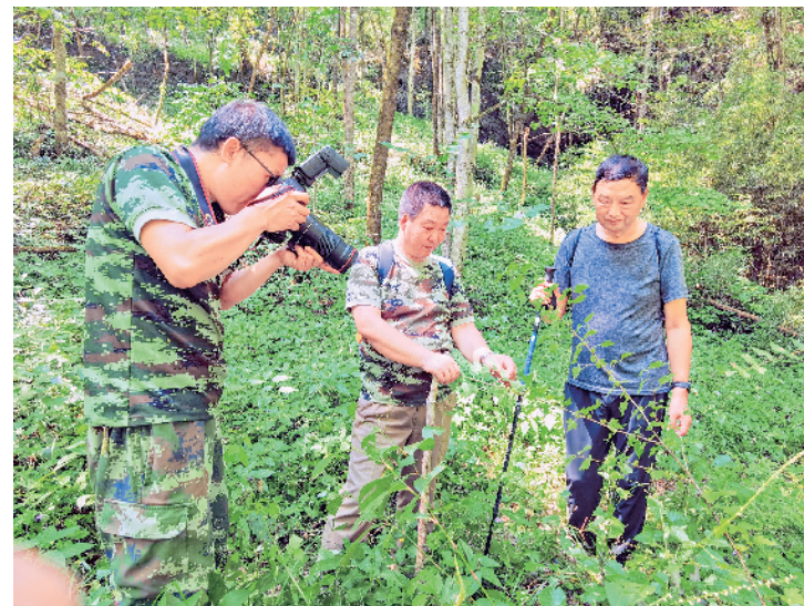
科考记录