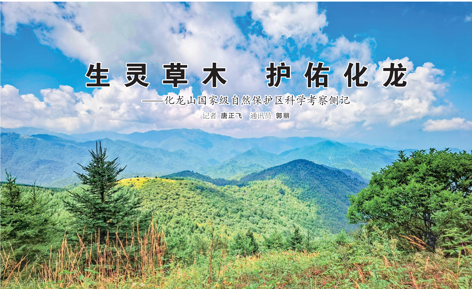
化龙山景

“山下是骄阳似火的夏天，山腰是百花齐放的春天，山顶是草木萧萧的秋天。”8月23日至24日，由市林业局、市科协、市林学会和陕西化龙山国家级自然保护区管理局组织了30余位专家对化龙山进行了深度的科学考察，一位队员深有感触道。