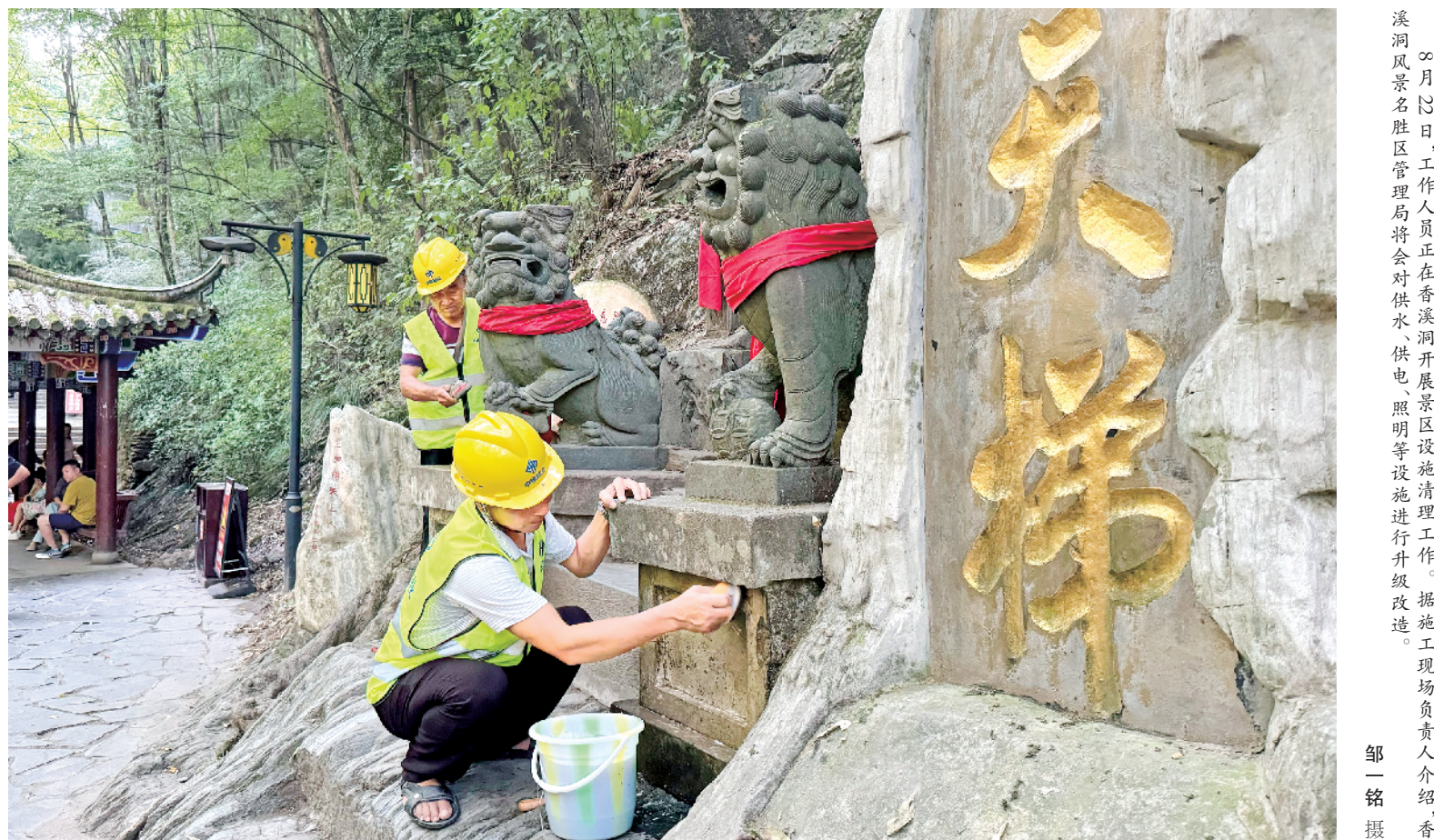
20 月 13 日，工作人员正在汉阴风景名胜区设施清理工作。据施工现场负责人介绍，汉阴风景名胜区管理局将会对供水供电、照明等设施进行升级改造。