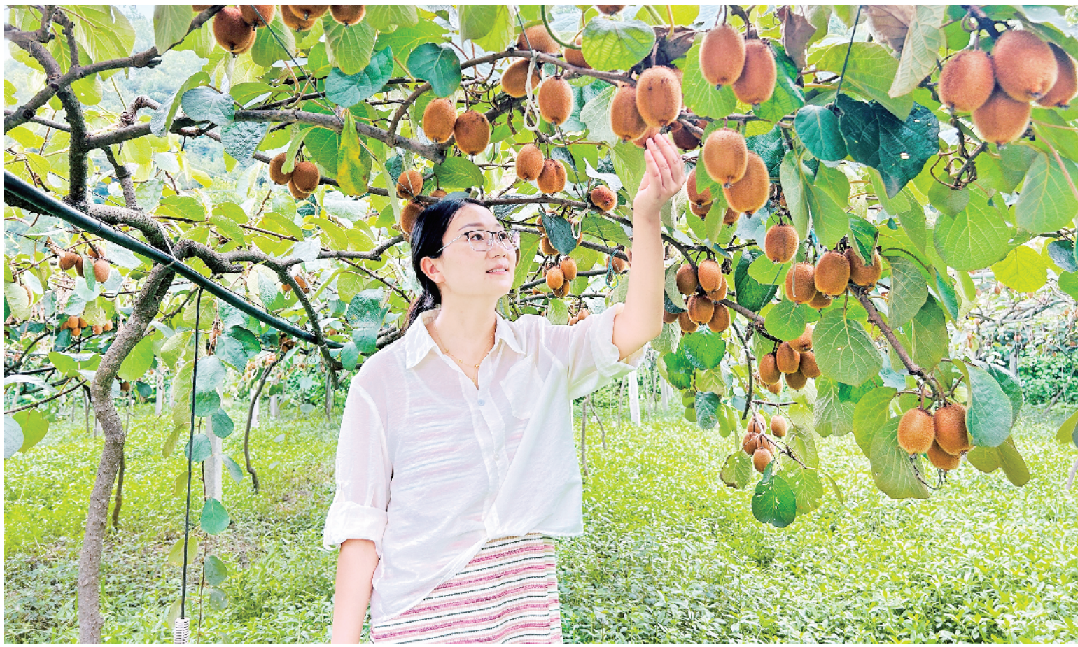
汉阴县观音河镇的30余亩猕猴桃即将进入采摘期。日前，在水田村，猕猴桃树枝繁叶茂，饱满的果实缀满枝头，散发着诱人的香气，令人垂涎欲滴。

编后语：暑假期间，面对农村儿童缺少照顾、“放羊式”的生活状态，市政府办驻紫阳县城关镇青中村工作队通过开办“多彩暑假·童心港湾”暑期托管班，邀请志愿者开展丰富多彩的关爱服务活动，不仅引导和帮助孩子们度过一个安全、快乐、有意义的暑假，解决了家长的后顾之忧，同时在此过程中，密切了党群、干群关系，让群众有了实实在在的获得感、幸福感。