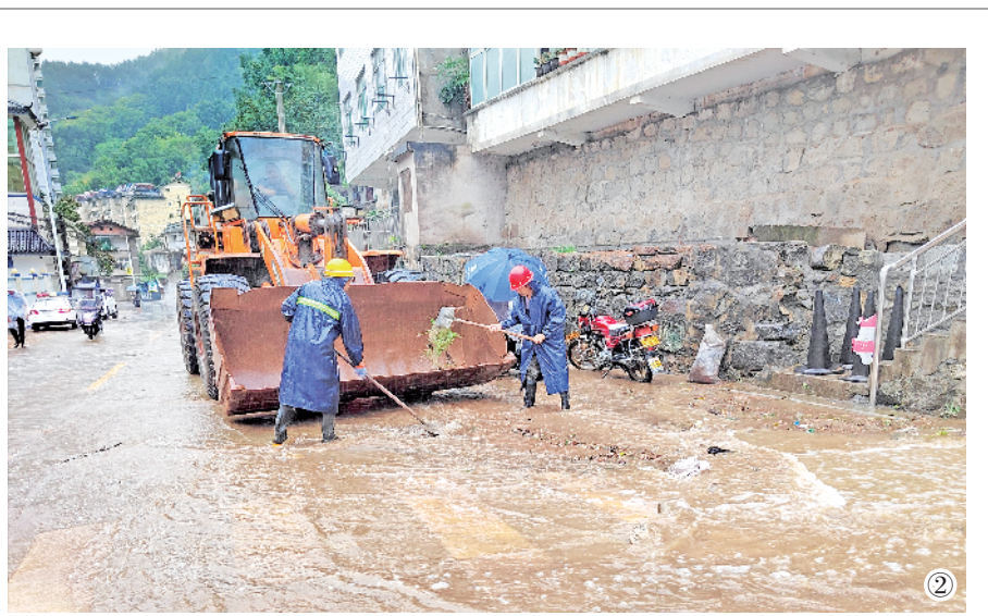
②日前,在G210国道宁陕县城段,工作人员正在清理道路积水。