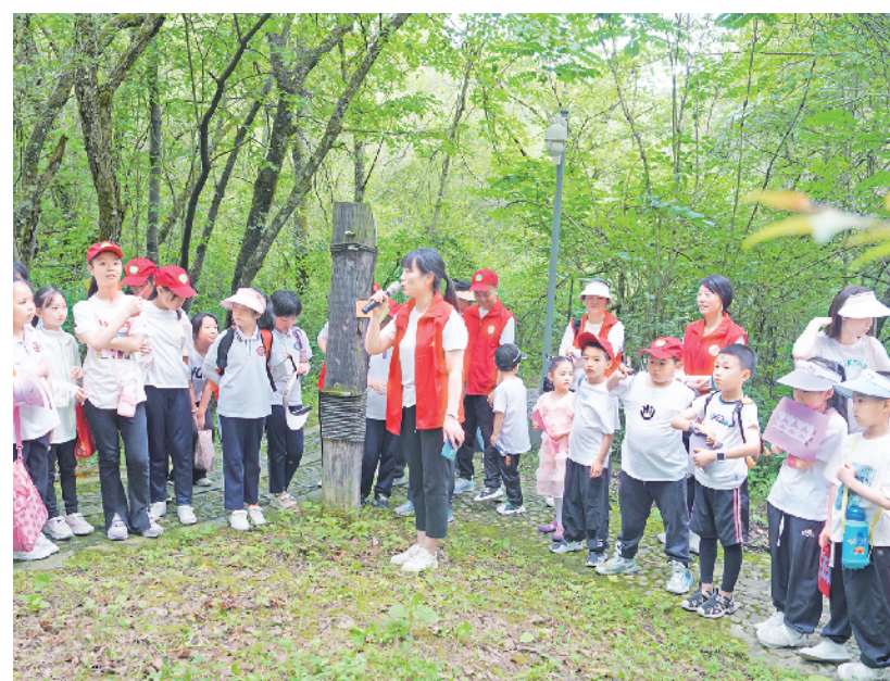
老师在海棠林为孩子们讲解

“春眠不觉晓,处处闻啼鸟……”伴随着明媚的阳光和孩子们欢快的笑声,7月4日,一场以“公益点亮梦想·文旅筑梦前行”为主题的山区儿童公益研学活动,在宁陕县渔湾逸谷国家3A级旅游景区和悠然山省级旅游度假区为山区儿童开启了一段充满惊喜与收获的探索之旅。