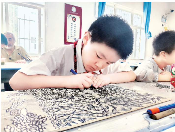
学生在认真雕刻