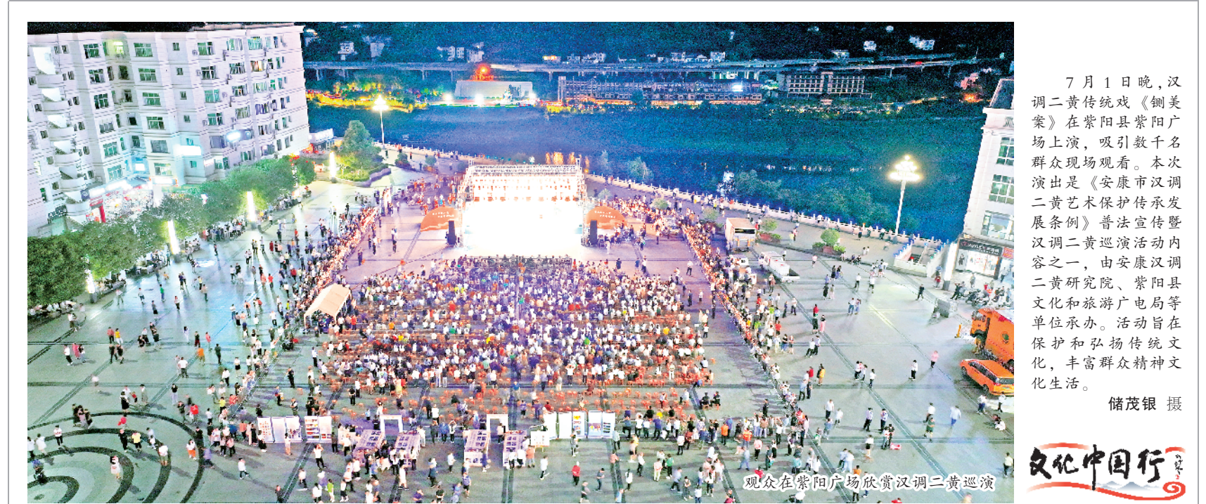
7月1日晚,汉调二黄传统戏《铡美案》在紫阳县紫阳广场上演,吸引数千名群众现场观看。本次活动由安康汉调二黄艺术保护传承发展基金会、紫阳县文化和旅游局等单位联合举办,旨在保护和弘扬传统文化,丰富群众精神文化生活。

“云上居”民宿今年刚建成营业,共有客房9间,民宿3楼配备了书吧、电影院等娱乐设施,慕名而来的游客络绎不绝。工作人员走进客房,对其空调、开关、插座进行“地毯”式排查,确保不留一丝安全隐患。同时,也提醒民宿工作人员要合理用电,避免长时间连续运行导致设备过热或损坏。除了对民宿内部的用电设备进行检查外,工作人员还对民宿周边的供电设施进行了巡视,检查了供电线路、变压器等设备的运行情况。