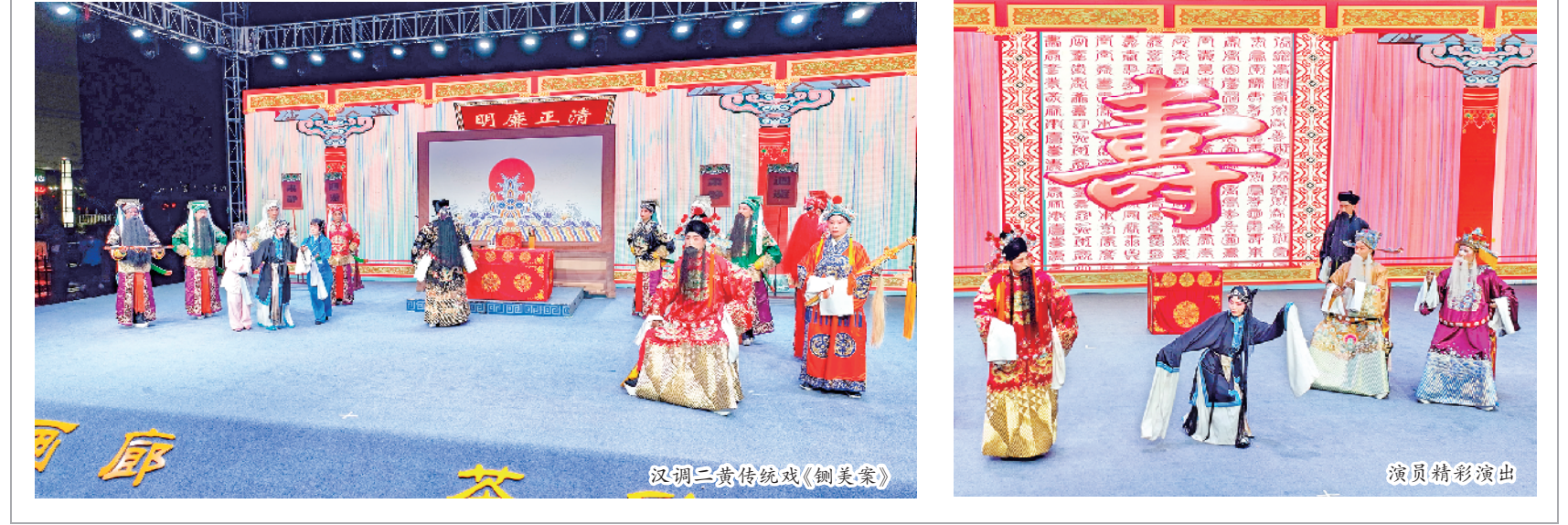
汉调二黄传统戏《铡美案》