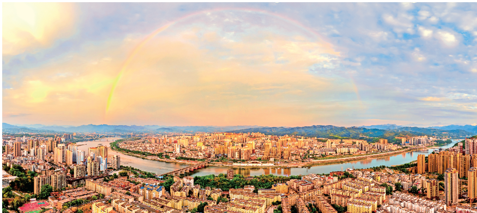
6月17日,我市中心城区迎来降雨。雨后一弯彩虹为夏日里的城市增添一份灵动。

分工合作,有条不紊。 档山村和福星村通过“企业+合作社+农户”的发展模式,与制药公司签订订单生产合作协议,共栽植200亩药用野菊,公司提供技术指导并按照保护价格收购,有效畅通了野菊花产、供、销渠道。 据悉,喜河镇将继续围绕菊花特色产业,大力开展招商引资,挖掘乡村多元价值,大力发展观光旅游、采摘体验等文旅融合新模式,推动菊花产业规模化、品牌化融合发展。 近年来,喜河镇坚持党建引领,围绕“乡村振兴、产业先行”理念,不断优化营商环境,因地制宜培育特色产业,持续做强做优“农业+”融合发展,推动农业产业“多点开花”,形成“山上果茶覆盖,山下特色蔬菜”的产业布局,做到农业提质增效、农民增收增收,为乡村产业振兴注入源头活水。