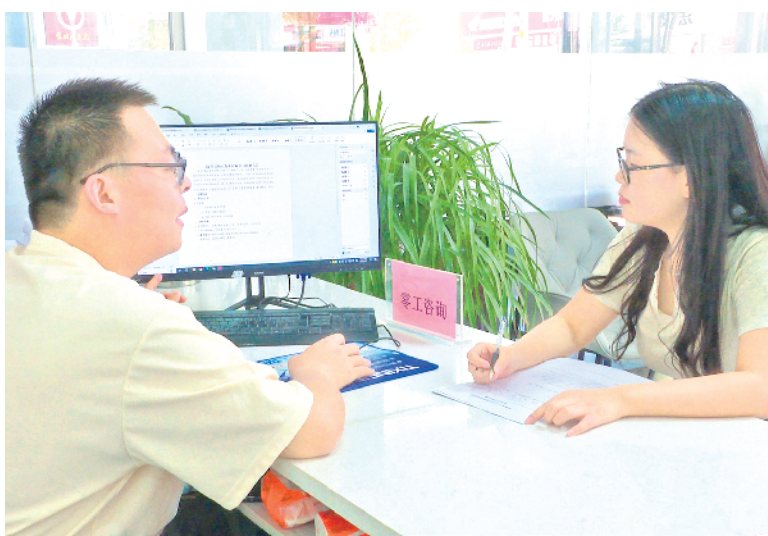
岚皋县零工市场的工作人员为求职者介绍岗位信息