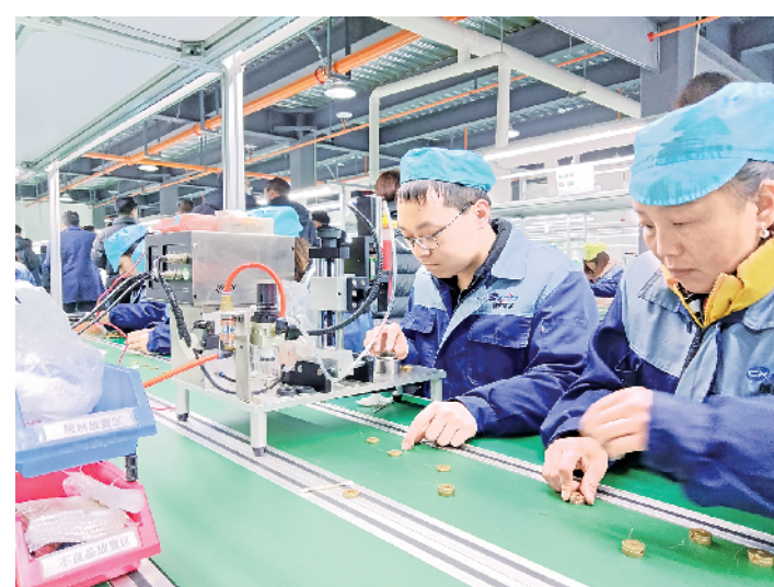
学员在安康诚铭电子科技有限公司稳岗就业