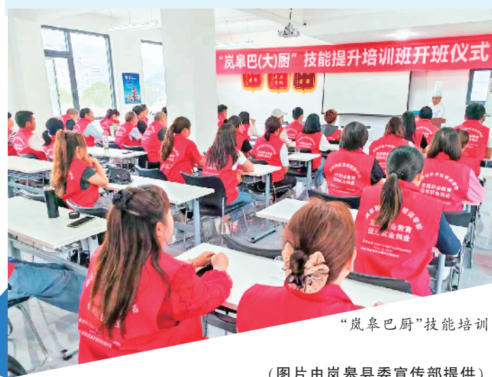
“岚皋巴厨”技能培训