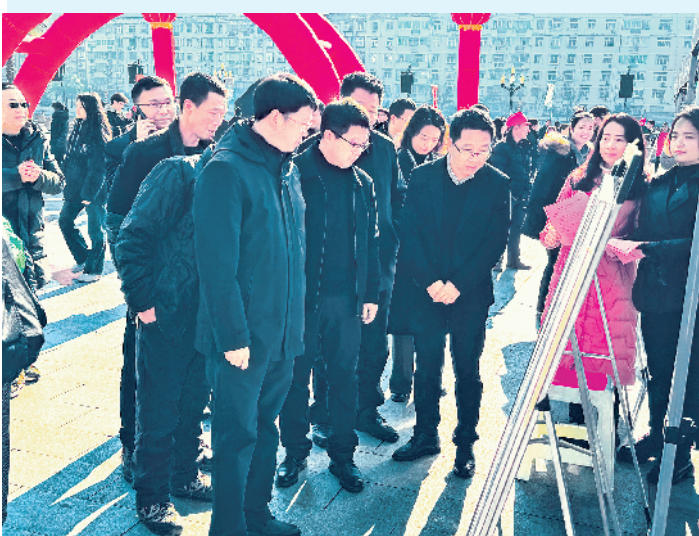
岚皋县领导现场督查企业招工用工情况