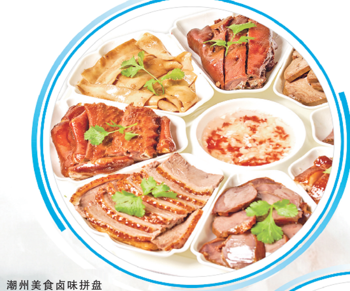
潮州美食卤味拼盘