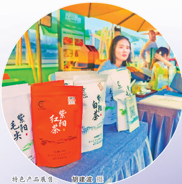
特色产品展售。