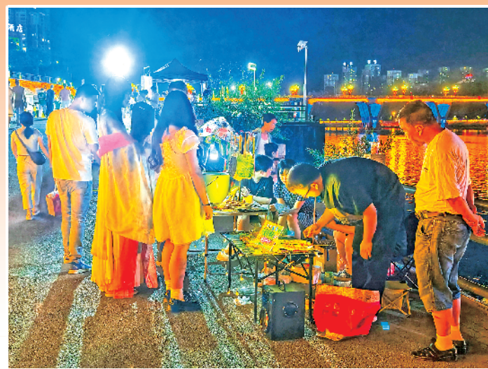
火热的江边夜经济。

第二十四届安康汉江龙舟节开幕在即,中心城区一江两岸夜经济升温,安康将以最好的状态喜迎盛会,以最优的服务接待八方来客。