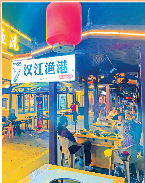
市民在西城坊品尝美食。