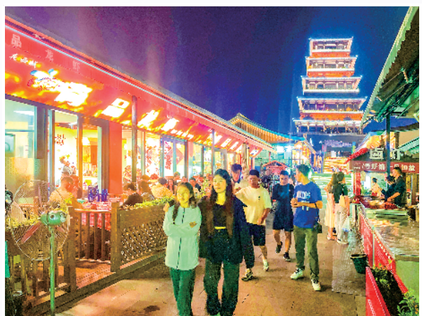
游人在西城坊美食街游览纳凉。