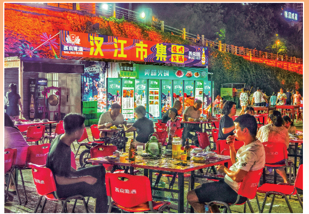
汉江市集热闹非凡。