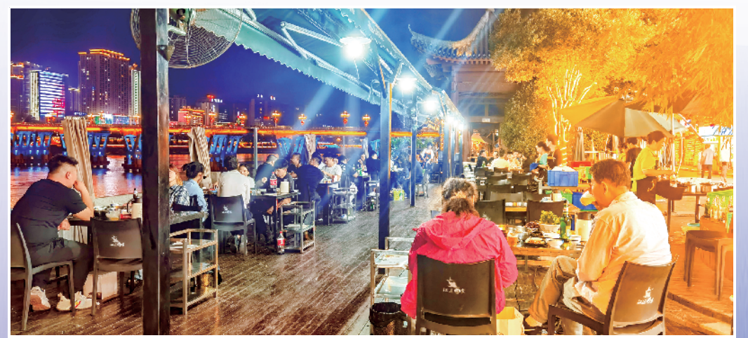
夜幕降临,市民们吹江风、品鱼宴,感受安康惬意慢生活。