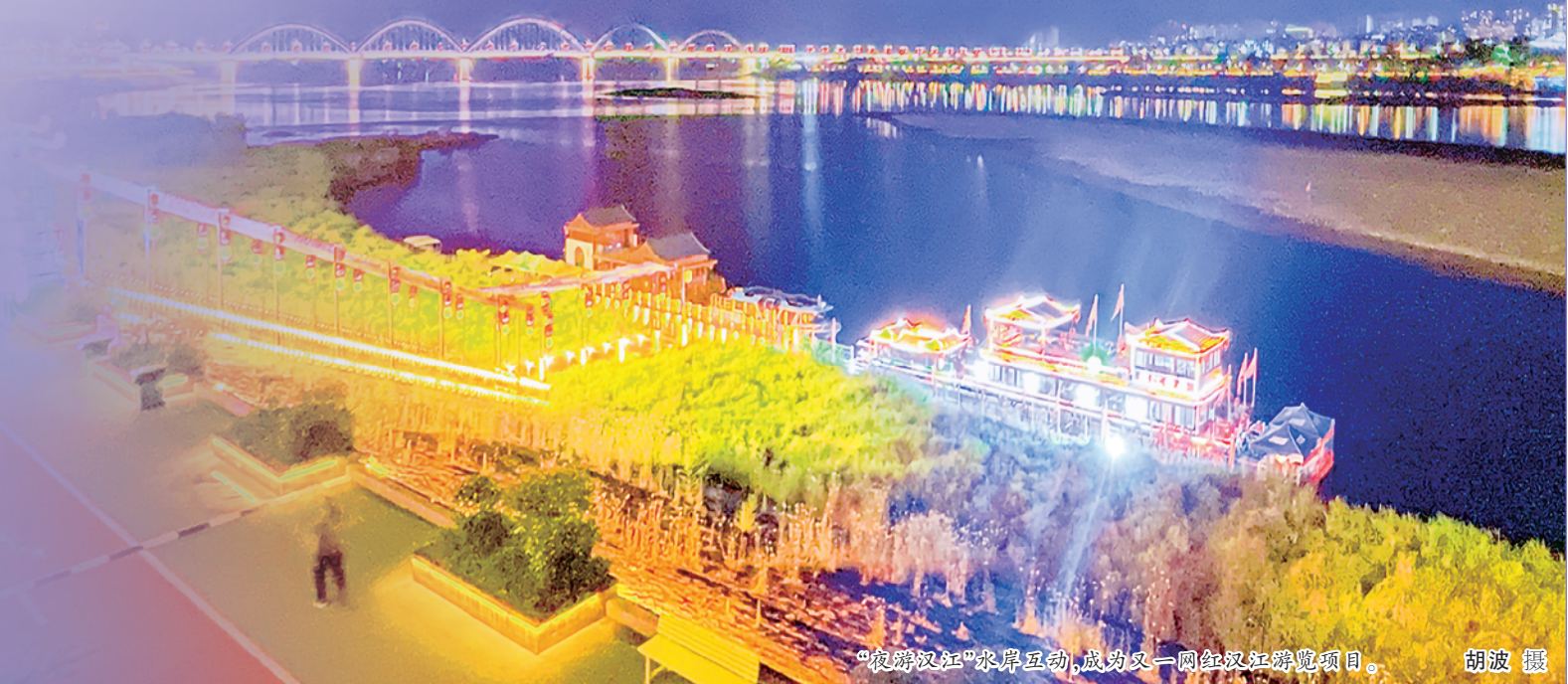
“夜游汉江”水岸互动,成为又一网红汉江游览项目。