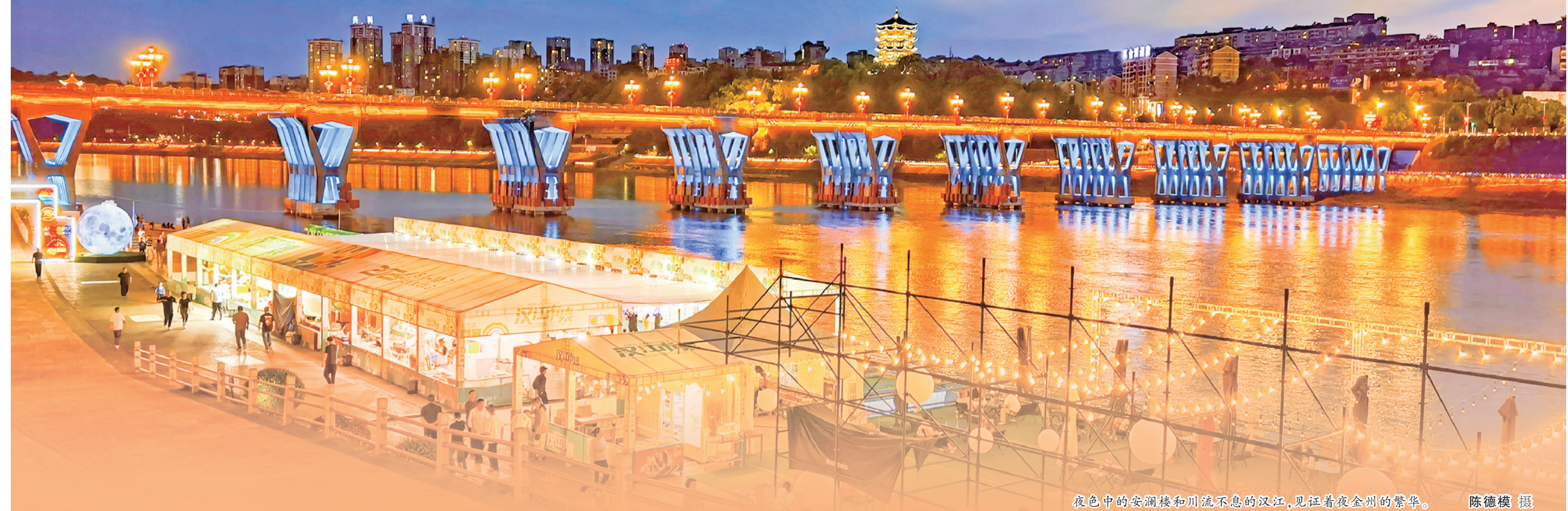
夜色中的安澜楼和川流不息的汉江,见证着夜金州的繁华。

第二十四届安康汉江龙舟节开幕在即,中心城区一江两岸夜经济升温,安康将以最好的状态喜迎盛会,以最优的服务接待八方来客。