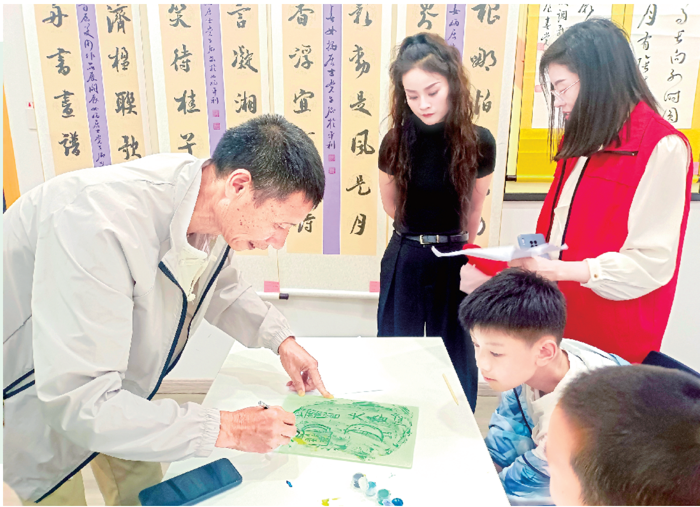
6月2日,平利县美术家协会践行“文艺六进”走进秦隆村镇镇银行,举行美术创作基地揭牌暨美术书法作品展。

去、请进来”的招商战略,坚持“四大班子”合力招商、领导干部带头招商、全县干部人人招商、县政协发挥优势招商,选派干部驻地招商,用好苏陕协作,建行、陕煤等国企帮扶力量,构建起“大招商”格局。去年全县累计外出招商80余次,对接线索项目43个,接待客商140余人次。项目引进的数量和质量实现双提升,共招引各类项目83个,协议资金130.77亿元,实际利用外资359万美元,连续三年获得安康市招商引资先进县。