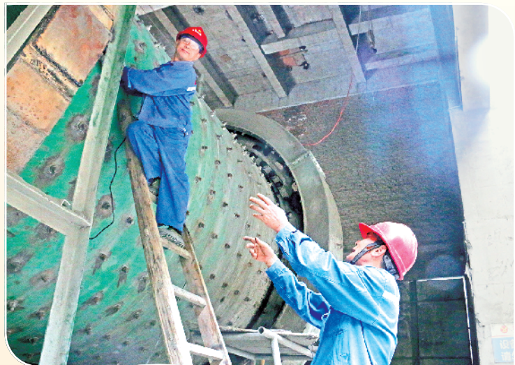
周金鱼缸内查看设备运行情况