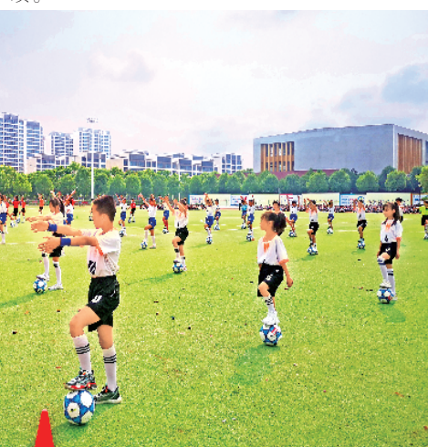
开幕式上的《足球少年》表演

无体育，不教育；无科技，没未来。建校以来，安康中学高新分校围绕“温度教育，全面发展”，深挖协同育人四大内涵，打造了协同育人五大阵地，开发了协同育人六大课程，丰富多彩的校园体育科技活动展示了安分师生的风采，凝聚了安分人的力量，开阔了学生的视野，提升了学生的能力，又培养了良好的审美情趣和人文素养。已经参加高考的两届 1977 名高中毕业生，取得了市状元 1 名、北大清华录取 3 人，一本上线率达到 80% 的好成绩。