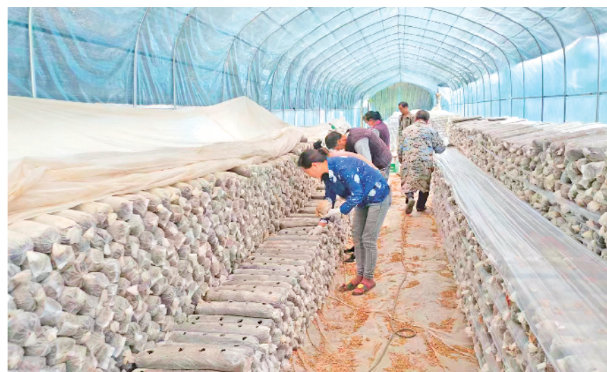
工人在大棚内忙碌

产业发展是乡村振兴的基石。裕丰食用菌种植专业合作社的初衷是以产业兴旺推动乡村振兴,让群众过上更加幸福