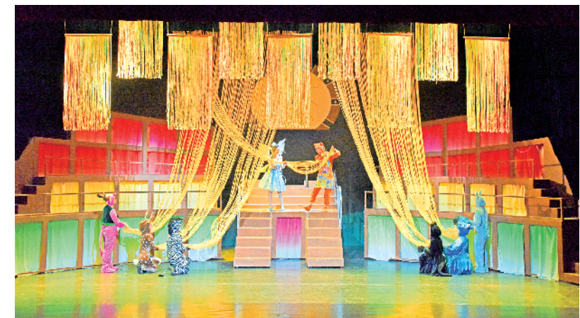
演出现场