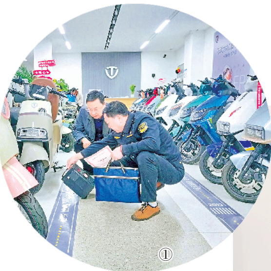
①执法人员检查电动自行车配件。