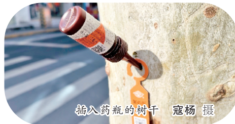
插入药瓶的树干

出行提醒: 插入的抑制水剂不会流出,也请过行人不要触碰拔下,以免影响树木吸收,导致防治失效。飞絮最为“繁多”时,市民出门可采取穿长袖、戴口罩、戴防护眼镜等方式,减少飞絮带来的影响。一旦飞絮不慎进入眼睛或接触皮肤致使发痒,切记“不慌、不揉、不挠”,立即用干净凉水冲洗或用湿纸轻轻擦拭,亦可用湿毛巾冷敷。