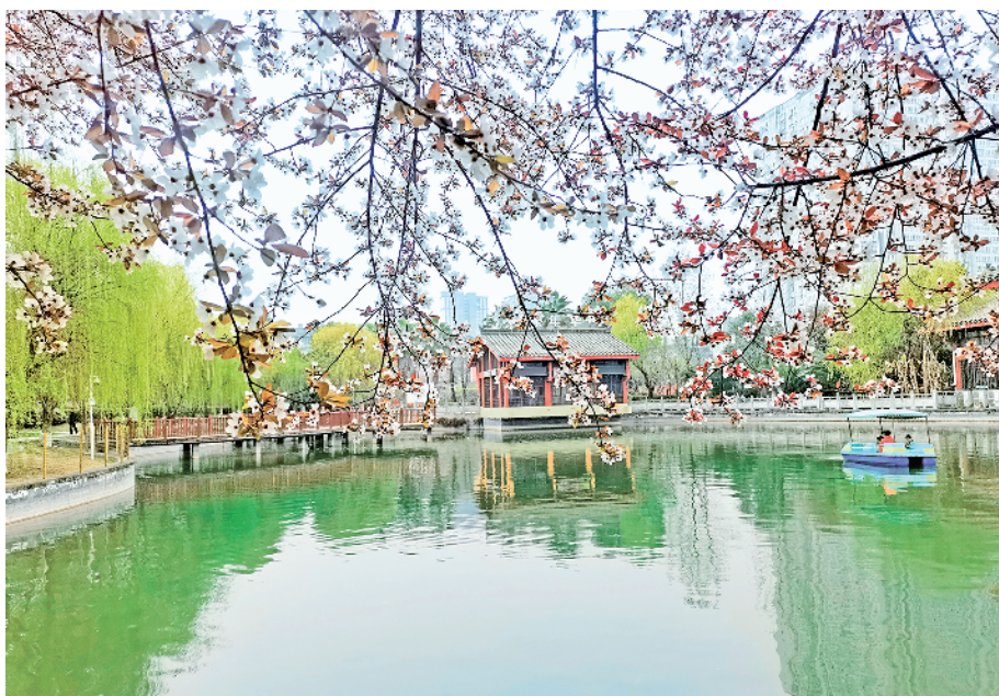
公园里的春天