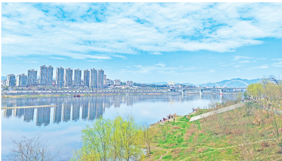
碧水春晖