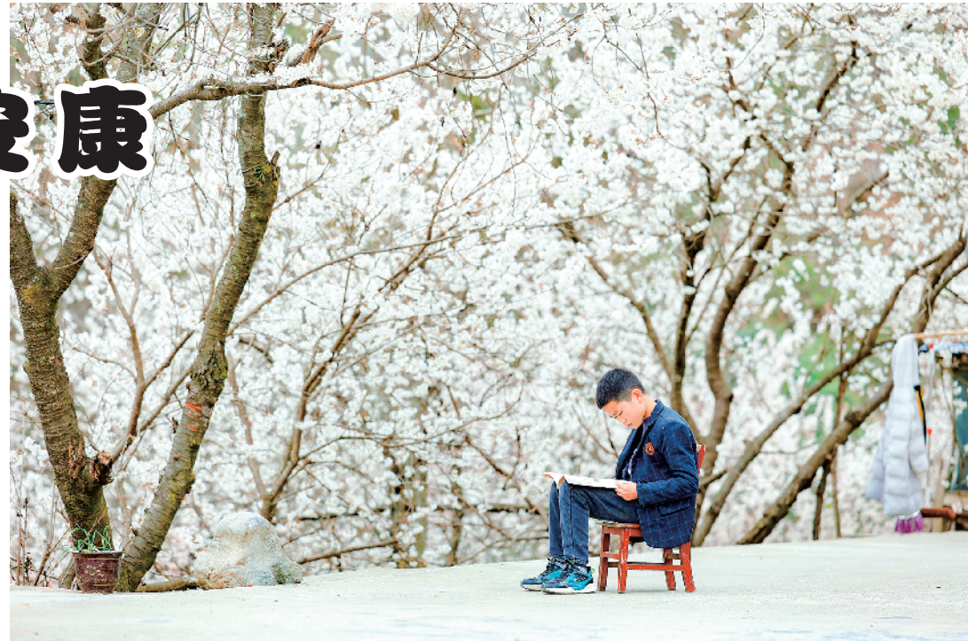
不负春光