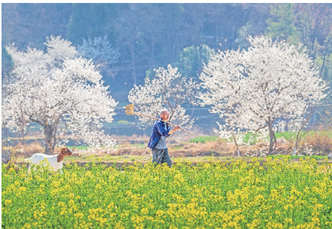
走在春风里