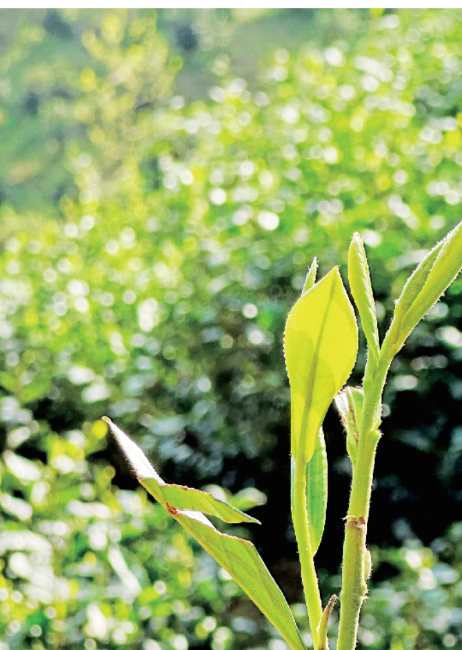
如约而至的春天