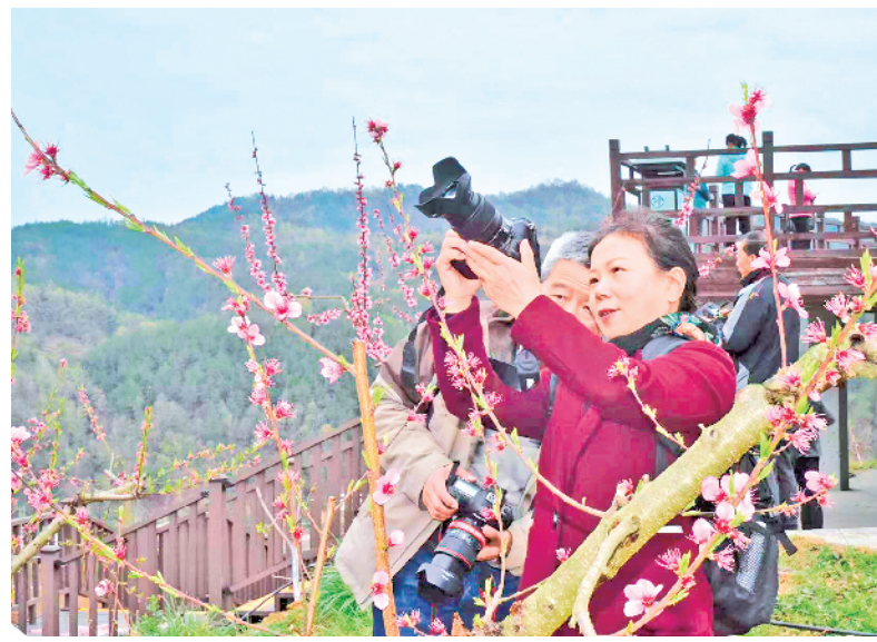
春天花开去摄影