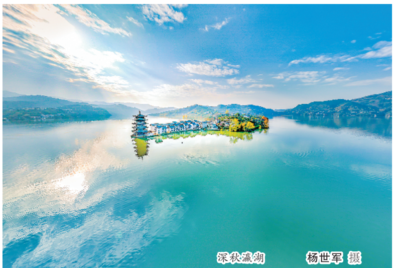
深秋瀛湖