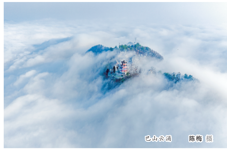
巴山云涌