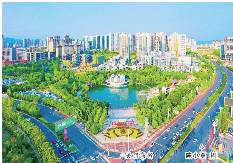
美丽高新

2024年新年伊始,市摄影家协会推出画册《这里是安康》。画册收录了协会会员的94幅作品,本期“视觉安康”栏目选取其中8幅供读者欣赏。