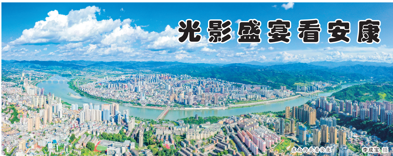
东南西北看安康