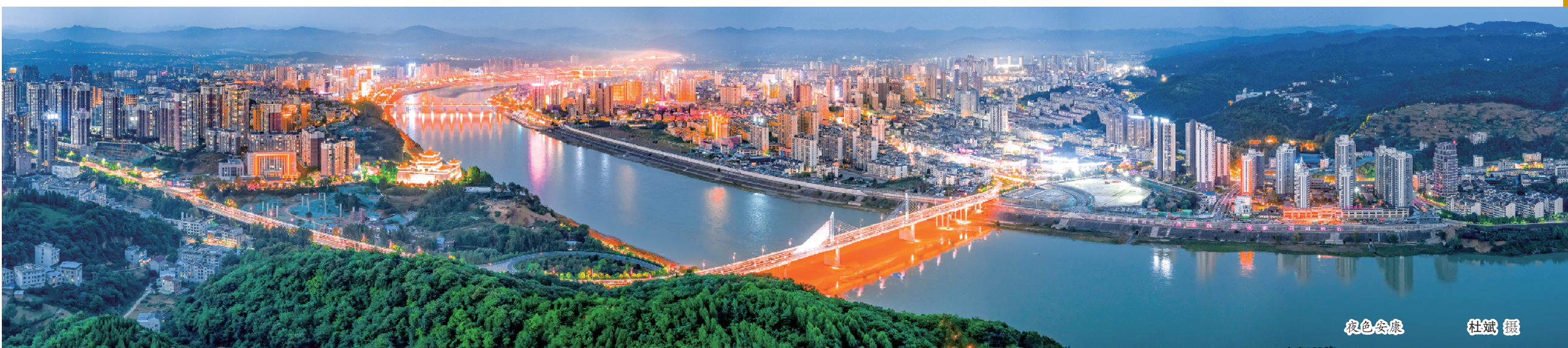
夜色安康