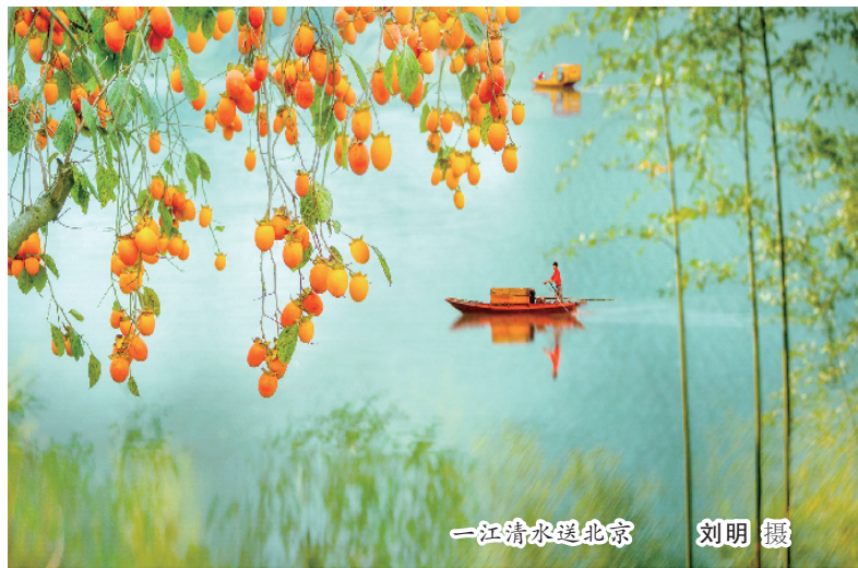
一江清水送北京