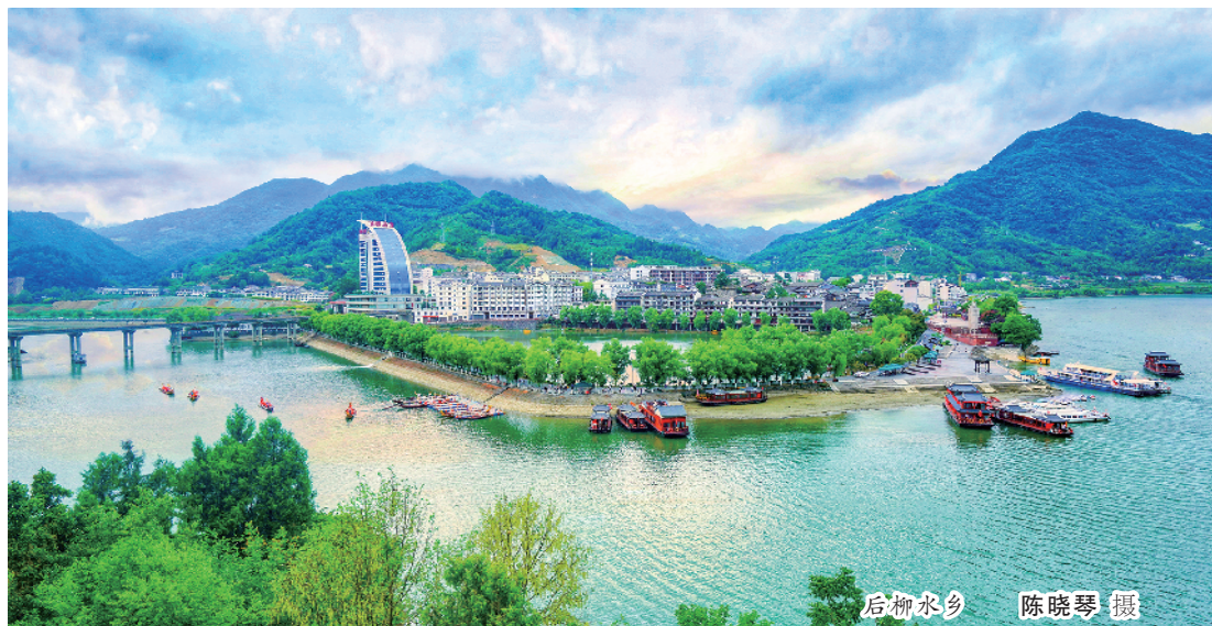
后柳水乡