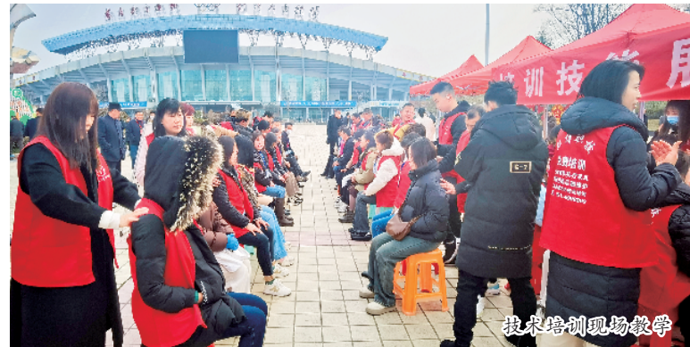
投资培训现场教学

安康市2024年“春风行动”暨春季产业大招工、苏陕劳务协作招聘会3月1日在全州广场启动。据介绍，此次招聘会汇聚了西安市、渭南市、江苏省常州市和我市的300多家企业，涉及精细化工、医药健康、纺织服装、装备制造、新材料等行业，提供就业岗位2.6万余个。