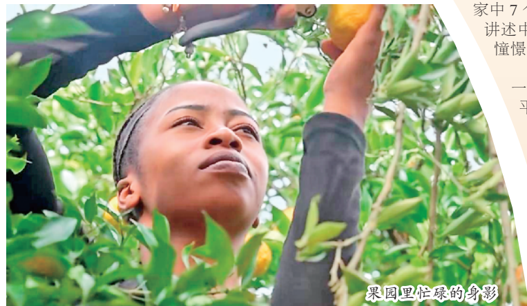
果园里忙碌的身影