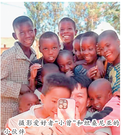
摄影爱好者“小曾”和坦桑尼亚的小伙伴