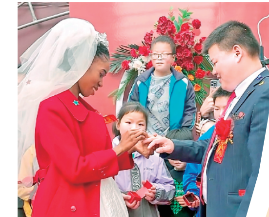
姐姐拉乌与平利小伙喜结连理