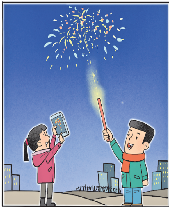
在指定区域燃放，远离人群和易燃物