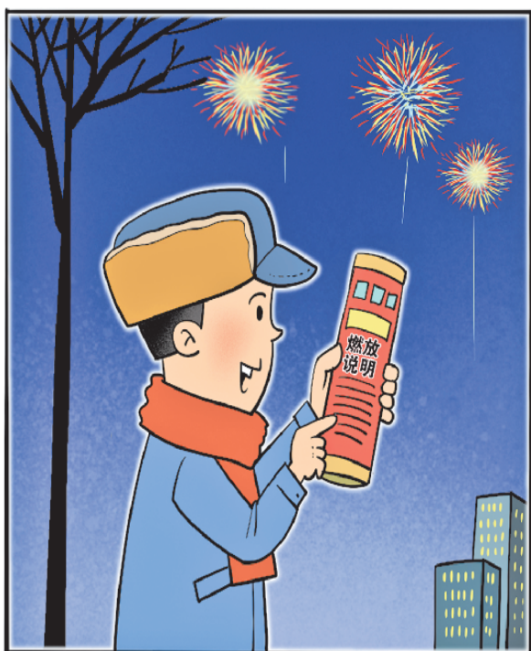
认真阅读燃放说明和注意事项，正确燃放