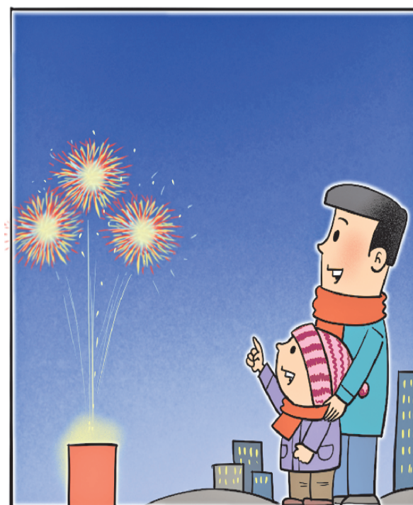
儿童需在成人监护下燃放，避免发生意外