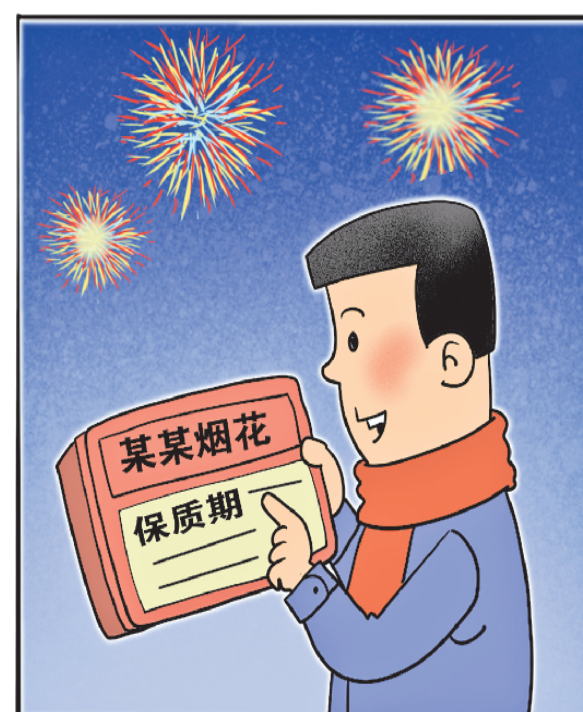
确保产品在保质期内使用