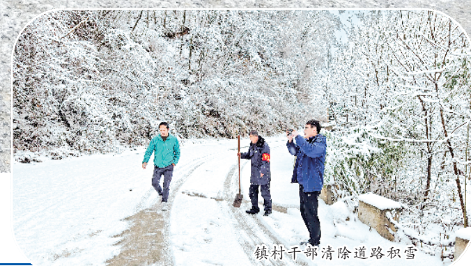
镇村干部清除道路积雪