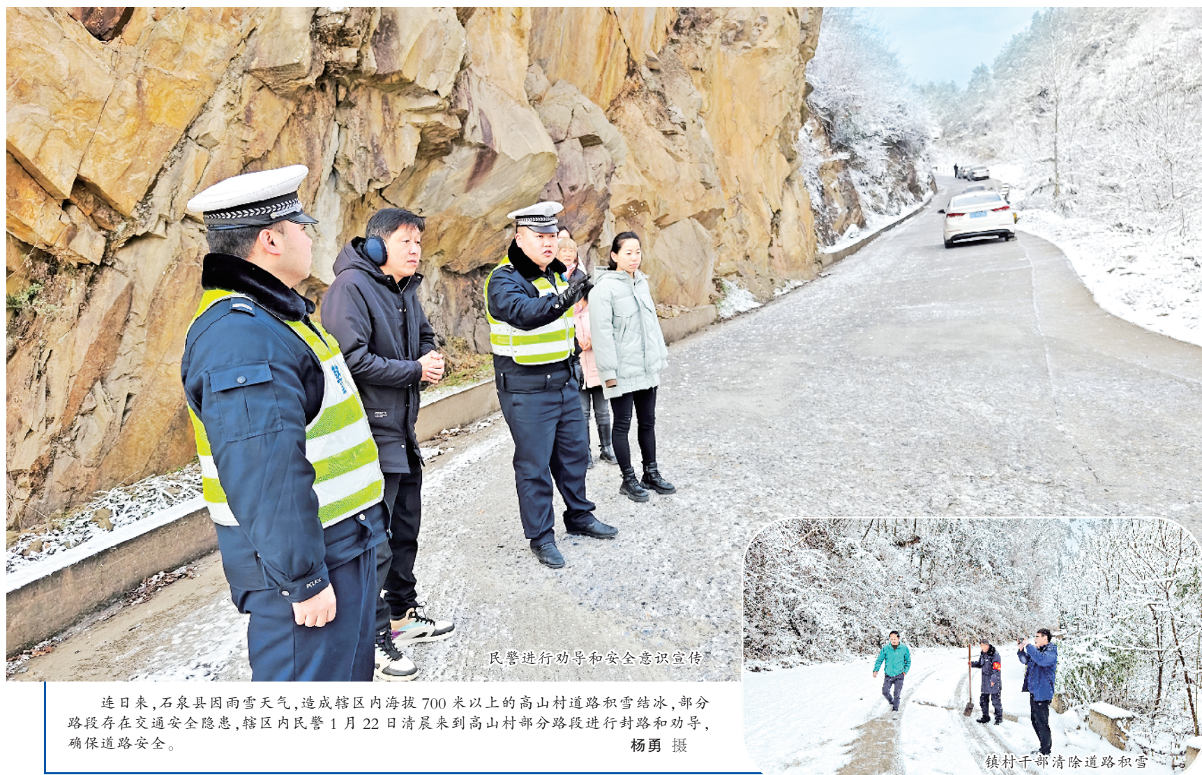
连日来,石泉县因雨雪天气,造成辖区内海拔700米以上的高山村道路积雪结冰,部分路段存在交通安全隐患,辖区内民警1月22日清晨来到高山村部分路段进行封路和劝导,确保道路安全。

早安排。该局要求各行政事业单位要坚持资产管理与预算管理、财务管理紧密结合,整齐划一高质量完成资产年报月报工作。细化工作任务,夯实工作职责,从资产清查盘点、数据治理、账账核对等方面落实专人负责。充分利用信息化统计手段,努力向全县人民交一本行政事业性国有资产的“明白账”。