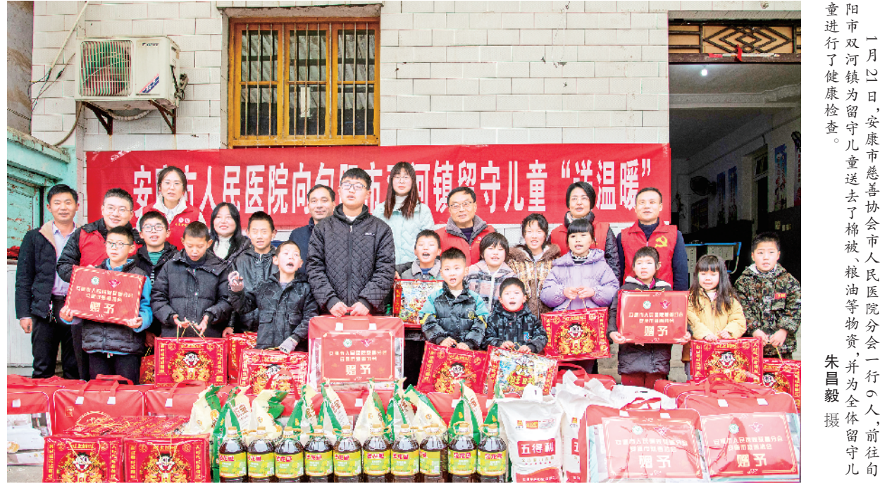
一月廿三日，安康市慈善协会市人民医院分会一行八人，前往旬阳市留河镇为留守儿童送去棉被、粮油等物资，并为全体留守儿童进行了健康体检。

场次，设立青少年体育后备人才基地10个，参加国际国内大规模体育赛事80余场次，竞技体育水平不断提升，广大群众自发组织健身广场舞、健步走、自行车、太极拳等20余项全民健身活动掀起全民健身热潮。全县中小学开齐开足体育课程，多样化开展体育教学和社团活动，做到“教会、勤练、常赛”。建成国家4A、3A级体旅融合景区10个，扎实开展大型体旅品牌赛事活动，促进了体旅融合协调发展。