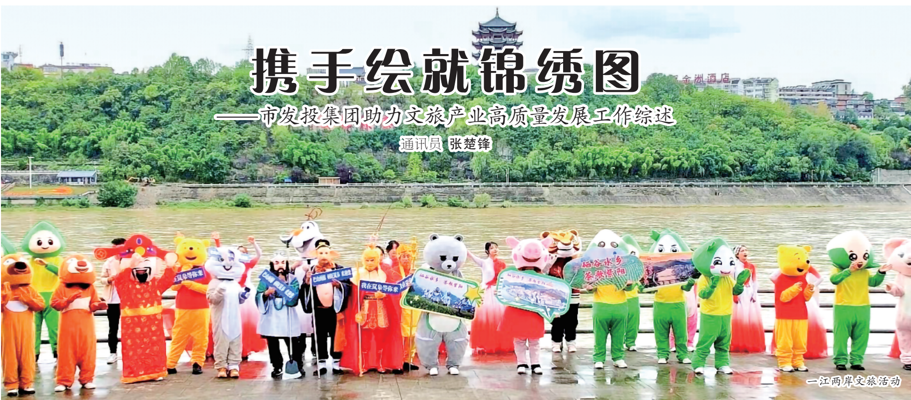
一江两岸文旅活动

近年来,市发投集团坚持以落实全市“十四五”规划文旅产业目标为出发点,紧扣文化旅游供给侧结构性改革,按照“政府引导、市场运作、盘活资产、做大做强、文旅融合、以文促旅、传承非遗、全域发展、品牌提升、经济提速”的工作思路,积极作为、多措并举,加大各项重点任务推进力度,助力全市文旅产业高质量发展。