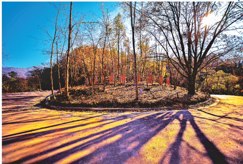
横溪湾万亩黄连基地一角