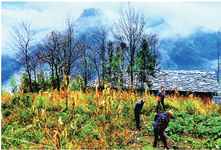
保存完整的巴山特色民居——石板房