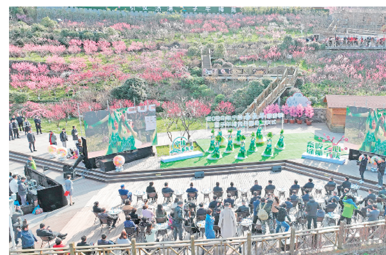
宁陕县梅子镇子午梅苑