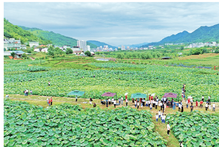
紫阳县蒿坪镇百亩荷塘