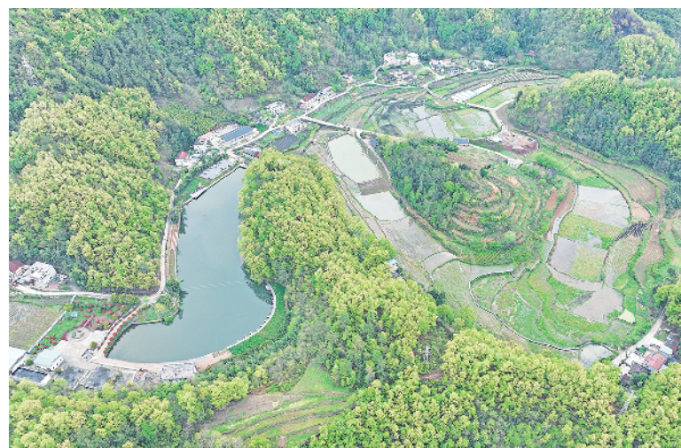
石泉县城关镇草池湾风光