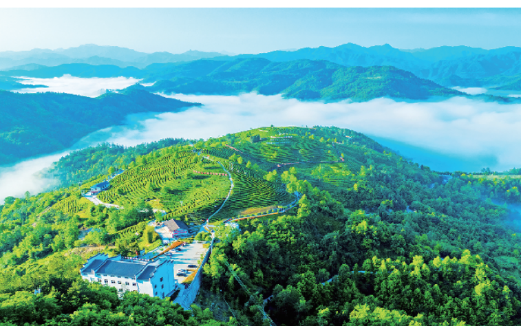
平利县老县镇蒋家坪茶山