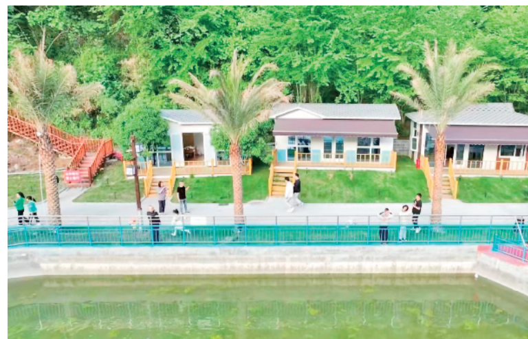
岚皋县简河镇芳流渔歌民宿