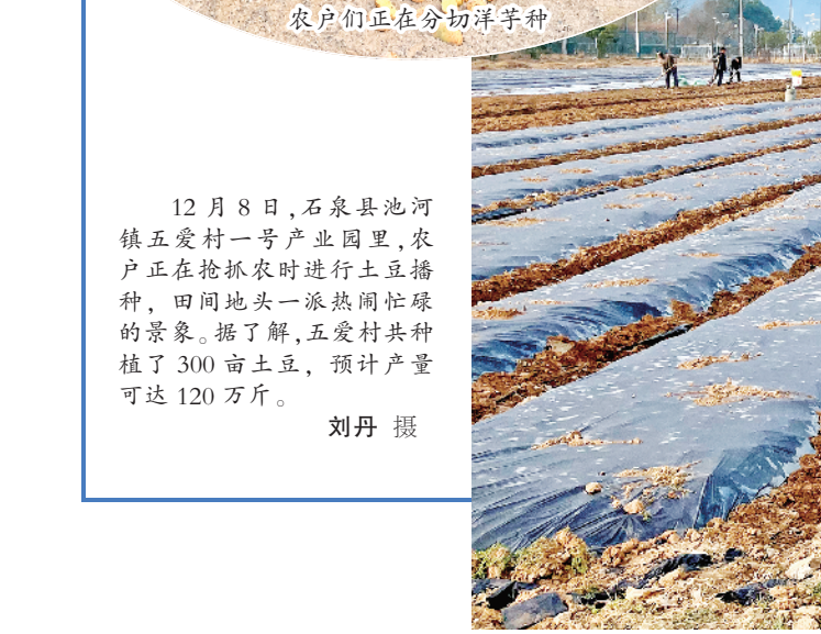
农户们正在分切洋芋种

12月8日,石泉县池河镇五爱村一号产业园里,农户正在抢抓农时进行土豆播种,田间地头一派热闹忙碌的景象。据了解,五爱村共种植了300亩土豆,预计产量可达120万斤。