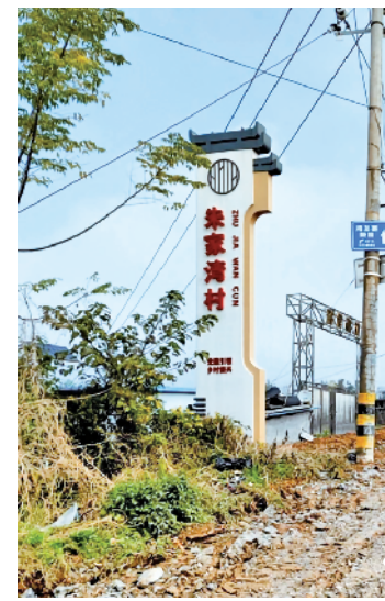
修复水毁道路,让群众出行更方便。

本报讯(通讯员 冯诚)近日,汉滨区江北街道朱家湾村一条长约200米宽度5米的水泥路修复完成并投入使用。看着宽阔平整又坚固的新水泥路面,路过的村民纷纷点赞。