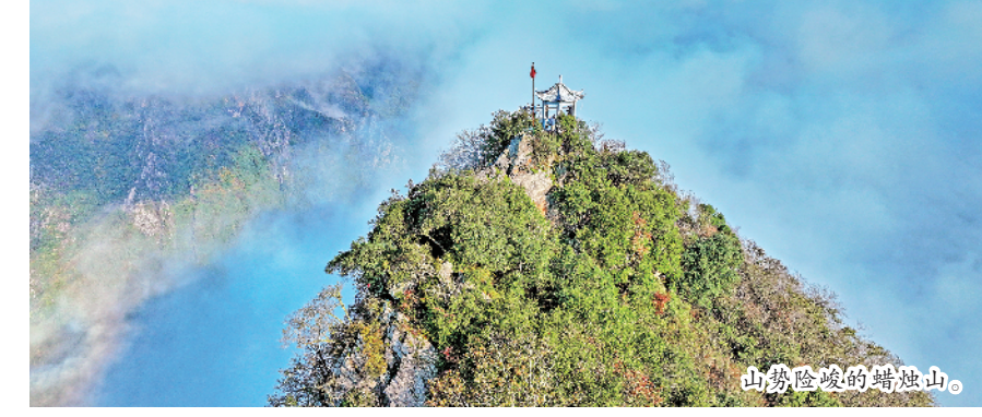
山势险峻的蜡烛山。