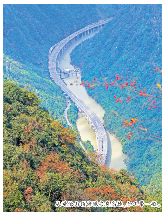
从蜡烛山顶俯瞰安岚高速,如玉带一般。