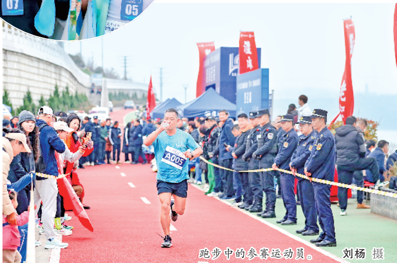
跑步中的参赛运动员。