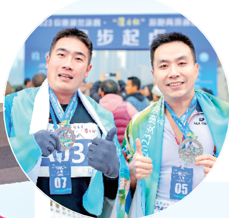
运动员展示奖牌。