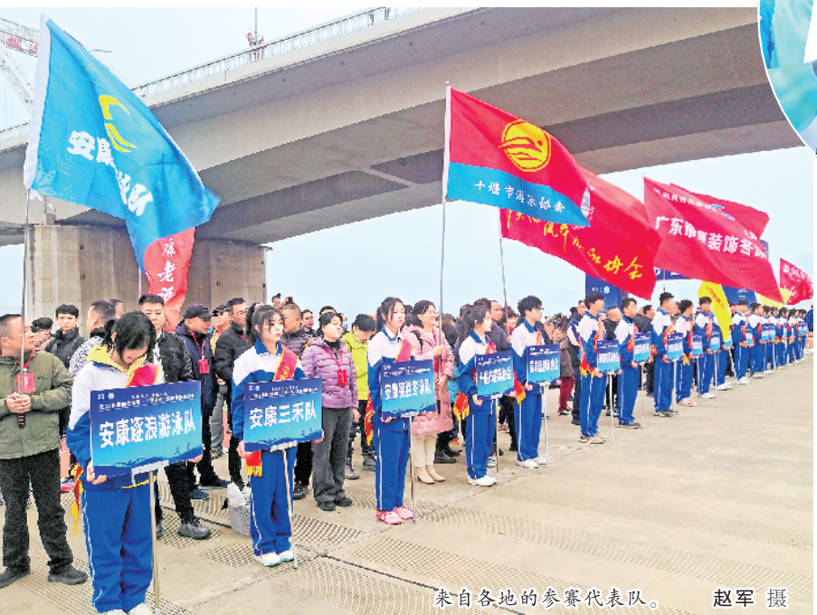
来自各地的参赛代表队。