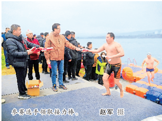
参赛选手领取接力棒。