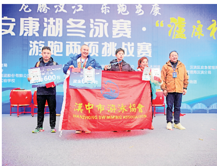
获奖队伍上台领奖。

为积极落实全民健身国家战略，推进全域旅游和全民健身相融合，汉滨区以举办群众有兴趣、能接受、能参与的精品体育赛事为抓手，开展全民健身运动，倡导健康生活方式。“本次活动的成功举办，充分展示了‘山水汉滨 自在安康’的金字招牌，有效带动了区体育、旅游等产业的发展。下一步，区教体局将继续探索‘体育+旅游’融合发展模式，努力打造一批有影响力的体育旅游精品线路、精品赛事，吸引更多的体育爱好者和游客到汉滨旅游、休闲、度假。”汉滨区体育指导中心负责人说。