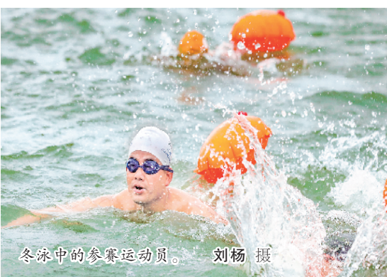
冬泳中的参赛运动员。