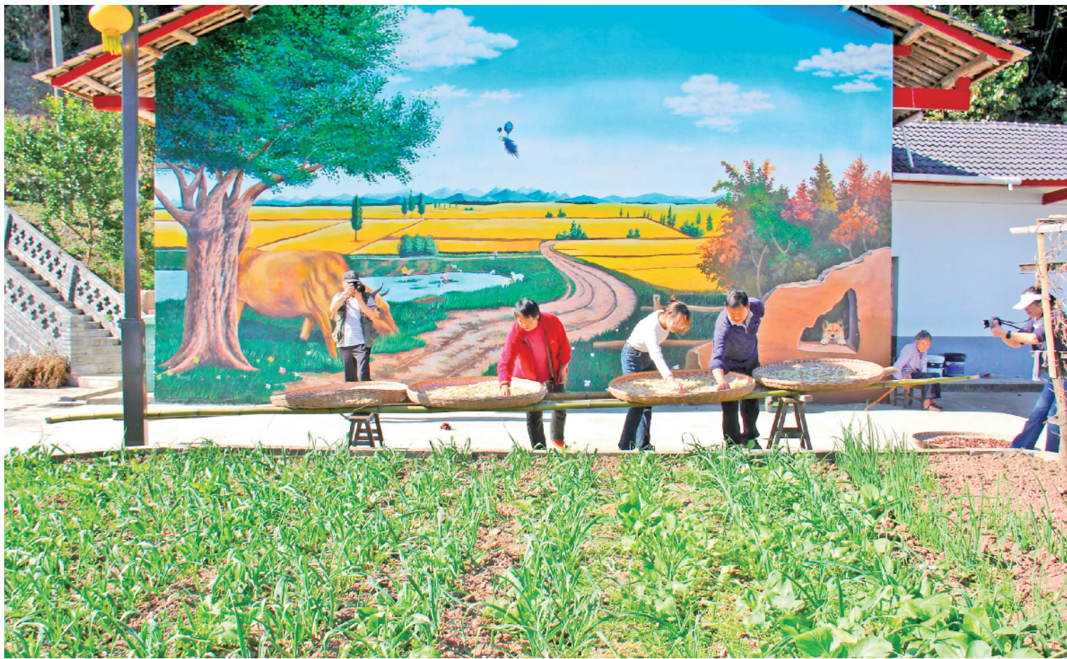
今年以来,岚皋县大道河镇月池台村以农村人居环境整治为重点,以旧房改造、农村改厕、和美庭院建设等为抓手,全面提升美丽乡村的“颜值”和“气质”。图为该村旧房改造后的胡家大院,田园风光令人赏心悦目。

提升效能助力企业发展。通过提供矛盾纠纷调解、企业员工招聘等服务,帮助企业解决各类急难愁盼的问题。抢抓近期出台的扶持政策机遇,第一时间落实政策要求,跟进配套措施,让企业群众第一时间享受政策红利。同时,坚持以企业需求为导向,广泛倾听企业诉求,保持良好的政企关系,创新工作思路,提升服务效能,为企业发展助力,为经济发展蓄能。