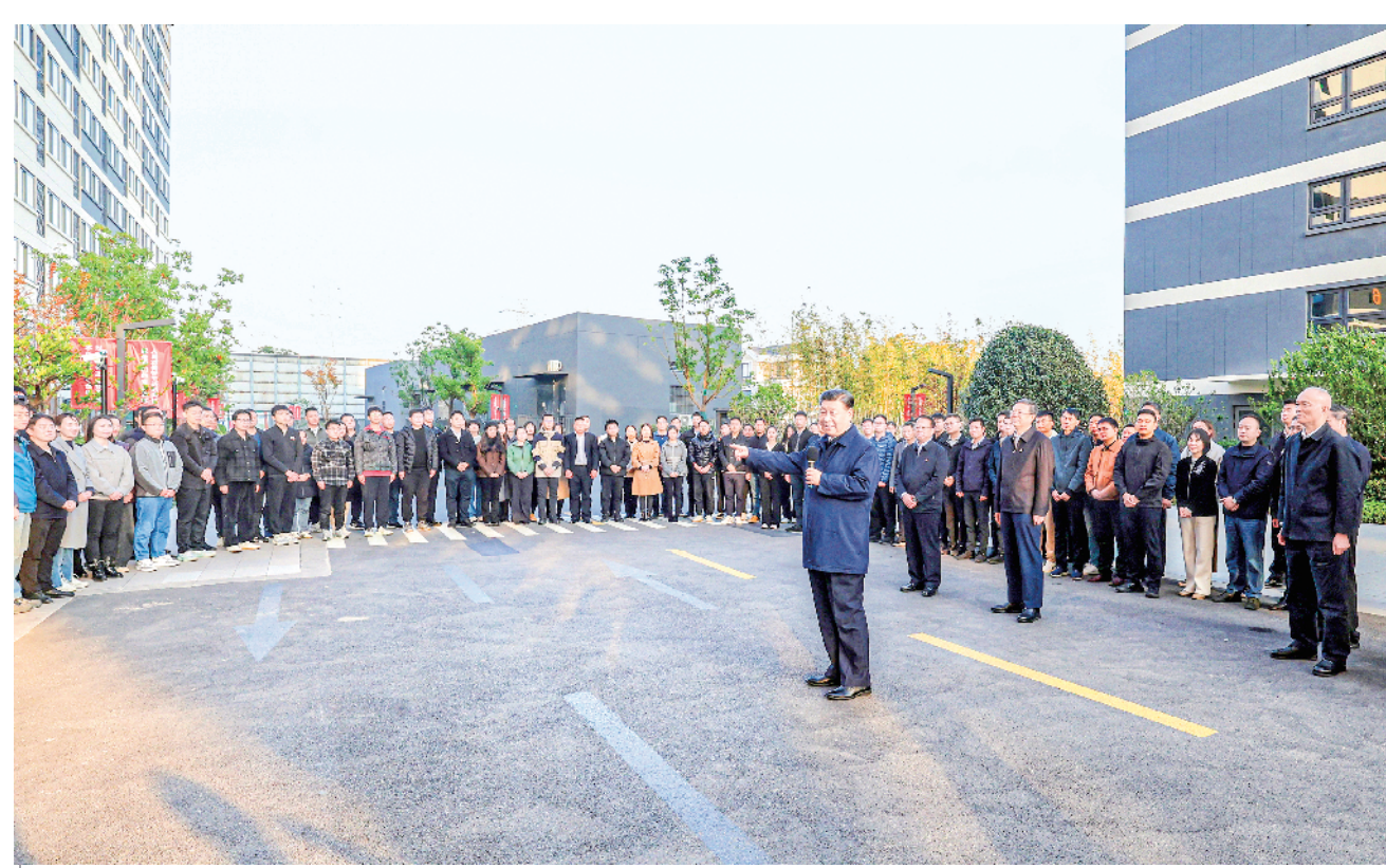
11月28日至12月2日，中共中央总书记、国家主席、中央军委主席习近平在上海考察。这是11月29日下午，习近平在闵行区新时代城市建设者管理者之家，同社区居民亲切交流。

新华社上海/江苏盐城12月3日电 中共中央总书记、国家主席、中央军委主席习近平近日在上海考察时强调，上海要完整、准确、全面贯彻新发展理念，围绕推动高质量发展、构建新发展格局，聚焦建设国际经济中心、金融中心、贸易中心、航运中心、科技创新中心的重要使命，以科技创新为引领，以改革开放为动力，以国家重大战略为牵引，以城市治理现代化为保障，勇于开拓、积极作为，加快建成具有世界影响力的社会主义现代化国际大都市，在推进中国式现代化中充分发挥龙头带动和示范引领作用。 11月28日至12月2日，习近平在中共中央政治局委员、上海市委书记陈吉宁和市长龚正陪同下，先后来到金融