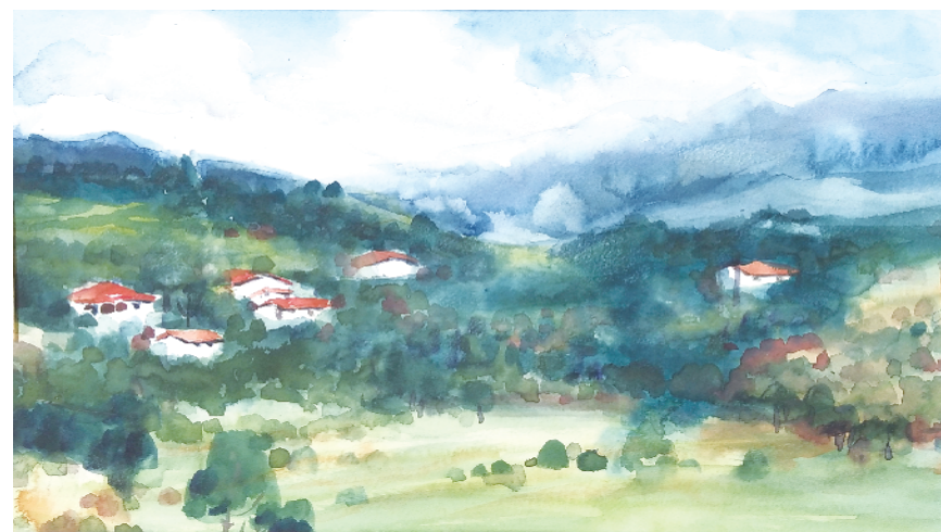
沧海桑田·盛夏(水彩画)