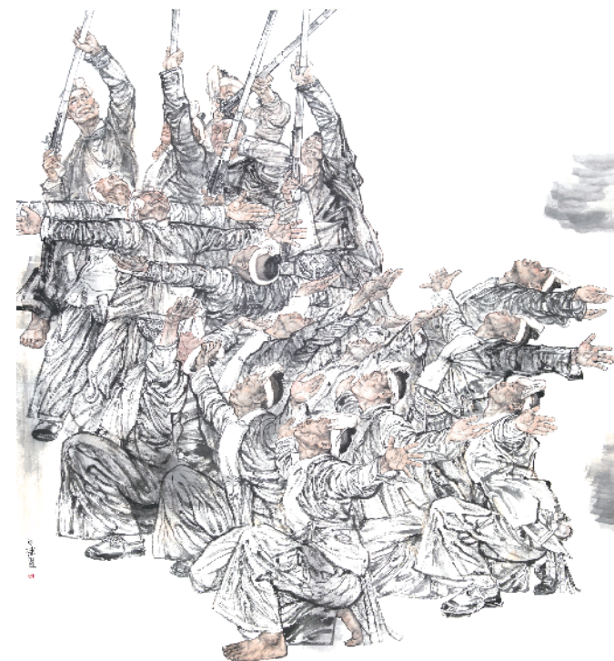
远古的新禧(中国画)