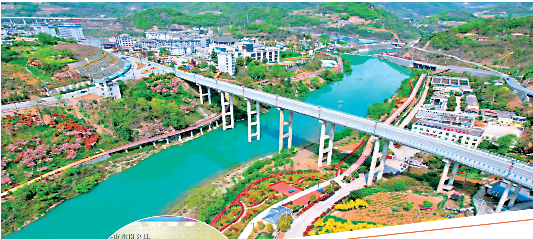
G511 国道城关镇罗景坪大桥