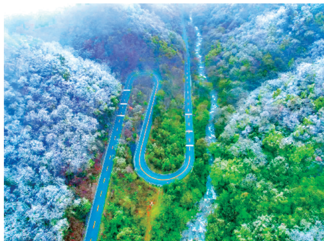
G211 岚城公路黑龙潭段。