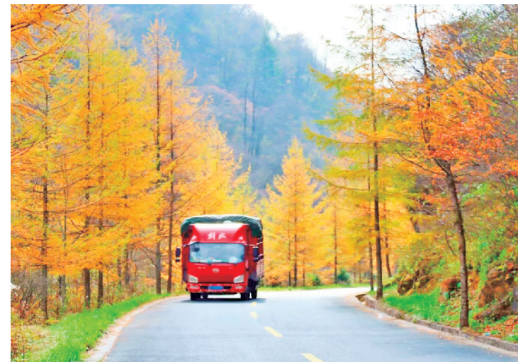
车辆穿行在如梦如幻的旅游路中。