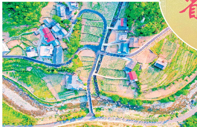
石门镇大河村乡村旅游路。

一条条通往大山深处、景区景点、产业园区、群众家门的“四好农村路”,串点为线、连线成网,为全县12个镇136个村(社区)的乡村振兴带来勃勃生机,实现了岚皋人民“出门水泥路、抬脚上客车”的生活梦想,为实现全县群众生活幸福、产业兴旺、乡村全面振兴提供了有力保障。