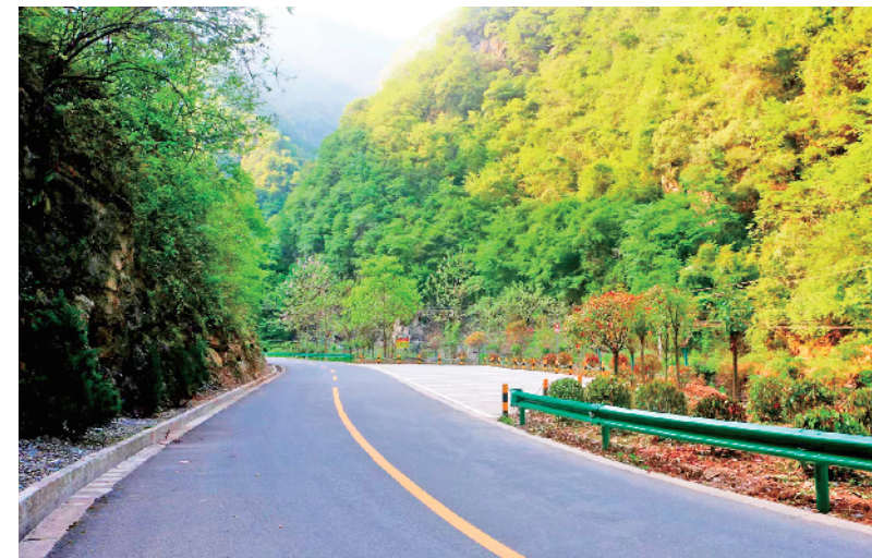
石门至懒稍台旅游公路4号观景台。