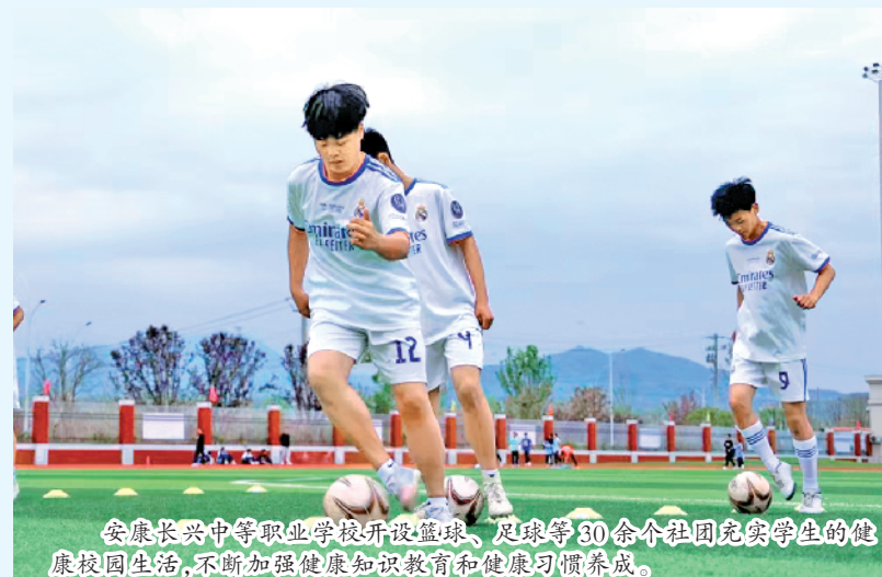
安康长兴中等专业学校开设篮球、足球等30余个社团充实学生的健康校园生活,不断加强健康知识教育和健康习惯养成。