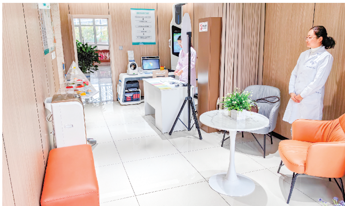
安康市卫健委在机关设置了健康小屋,通过体检一体机进行基础项目体检,对职工健康状况进行综合评估。