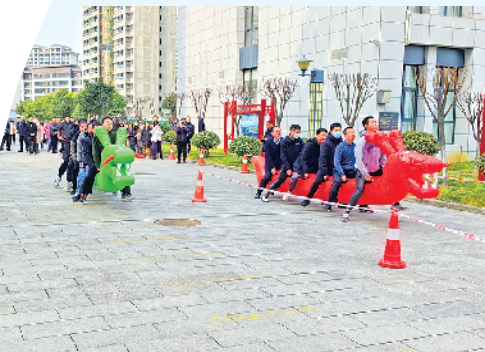
市公卫中心根据职工兴趣爱好,成立了13个兴趣小组,常态化开展活动,职工参与率达到90%以上,每月都会相互展示相互比拼。