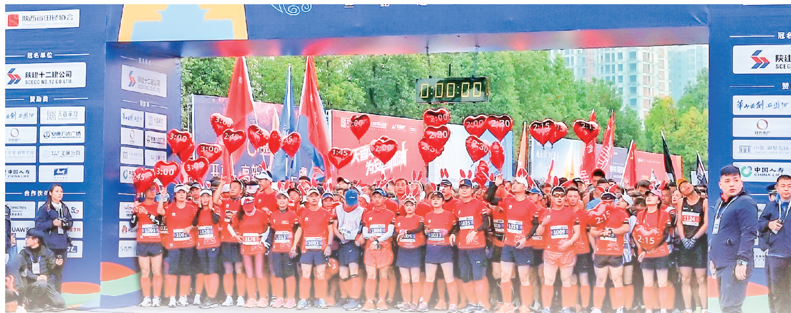
以安康半程马拉松为代表的多种运动形式已成为安康市民提高健康生活的主要方式。