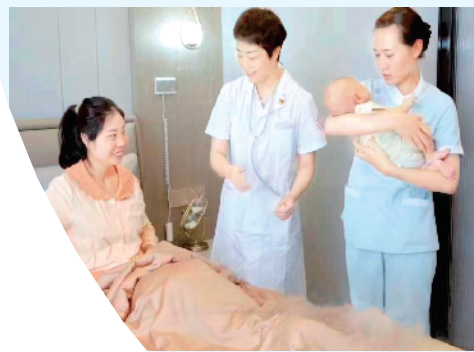
安康市妇幼保健院大力开展特需医疗服务,构建一站式母婴健康服务体系,在全市三级医院中首家开设母婴康养中心。