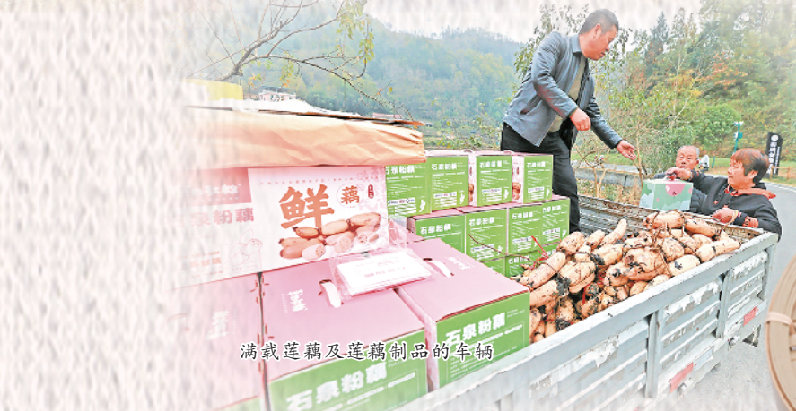
满载莲藕及莲藕制品的车辆