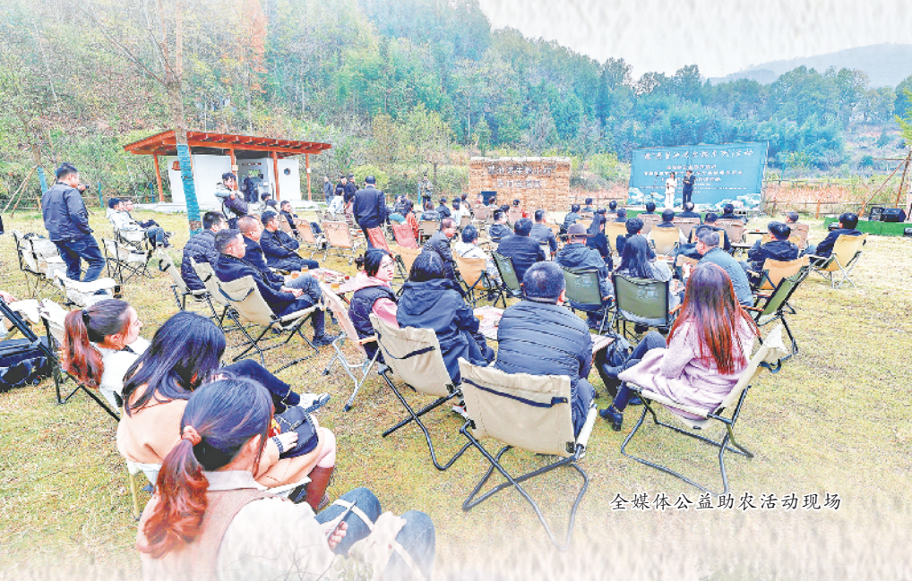
全媒体公益助农活动现场

据了解,草池湾田园综合体项目位于石泉县城关镇,是国宝朱鹮的栖息地。该项目从建设伊始就紧扣“山水田园、康养休闲、研学教育”定位,充分发挥生态资源优势 and 地域文化特色,探索出乡村生态生产生活“三生”融合、一二三产融合发展的高质量发展新路径。充分利用草湖林水自然资源,以可循环、可持续的绿色生态农业为基础,以“田园观光+康养旅居+农事体验+研学教育”为重点,以打造面向未来的自然教育产业为目标,打造了休闲垂钓园、百亩水稻体验园、田间步道、荷花塘、乡村会客厅、观鸟茶室、稻米工坊、茶空间等多种特色业态,在为广大游客和新老村民带来全新的旅游体验的同时,也帮助群众增收,进一步提升了人民群众的幸福感和获得感。目前,草池湾朱鹮小村已成为网红打卡地和县域经济发展新引擎。