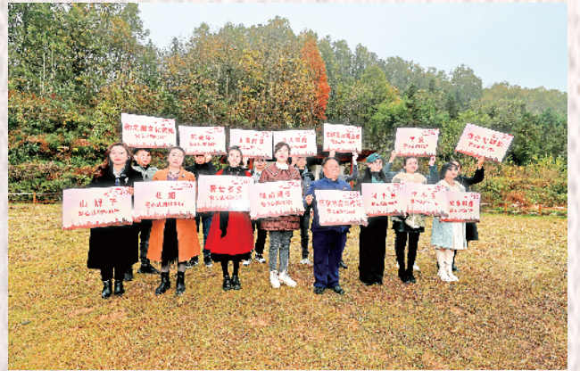
新媒体联合会网络达人爱心认购