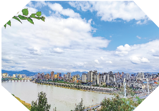
秋日的一江两岸和蓝天白云相映成趣，呈现出青山绿水的生态美景。