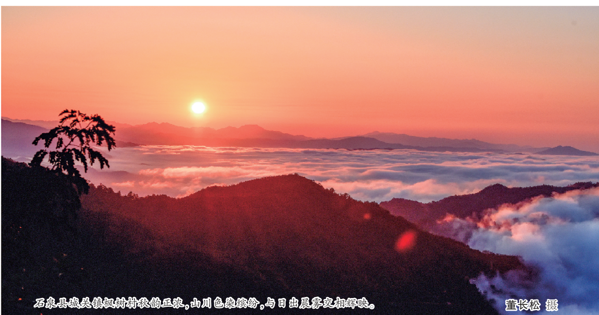
石泉县熨斗镇枫树村秋日的正景，山川色彩缤纷，与日出晨雾交相辉映。