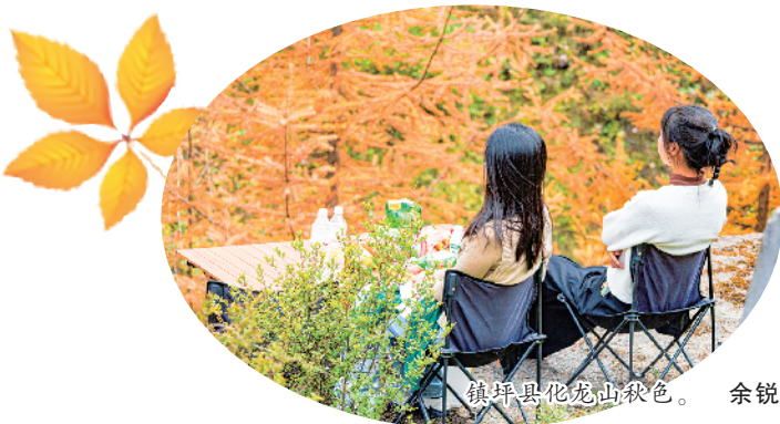
镇坪县化龙山秋色。