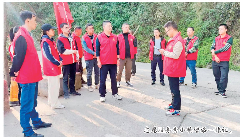
志愿服务为小镇增添一抹红。