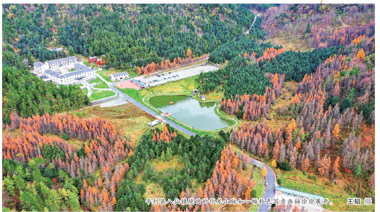
平利县八仙镇境内的化龙山秋色如一幅秋色写意画轴徐徐展开。