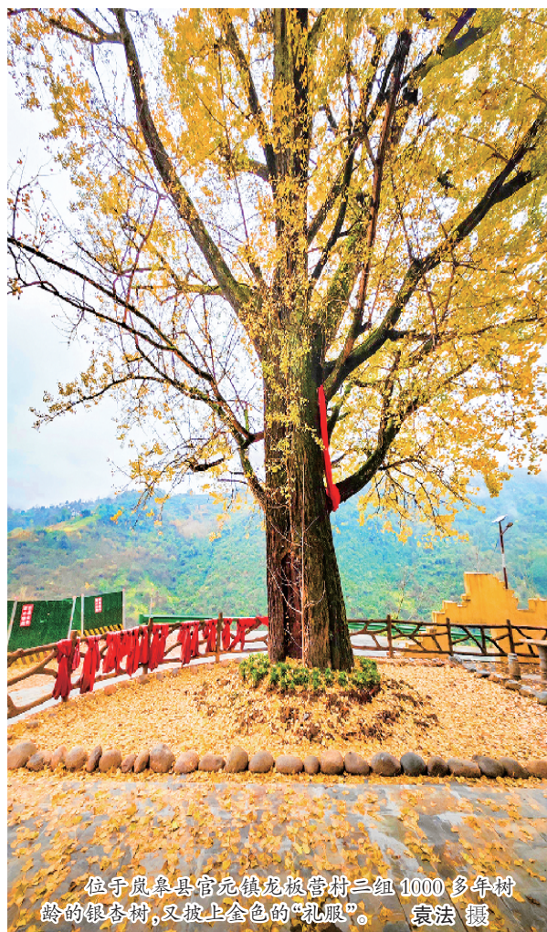
位于岚皋县官坝镇龙板村三组 1000 多年树龄的银杏树，又披上金色的“礼服”。