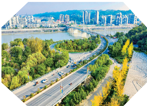
金秋时节的安康西津汉江大桥北。