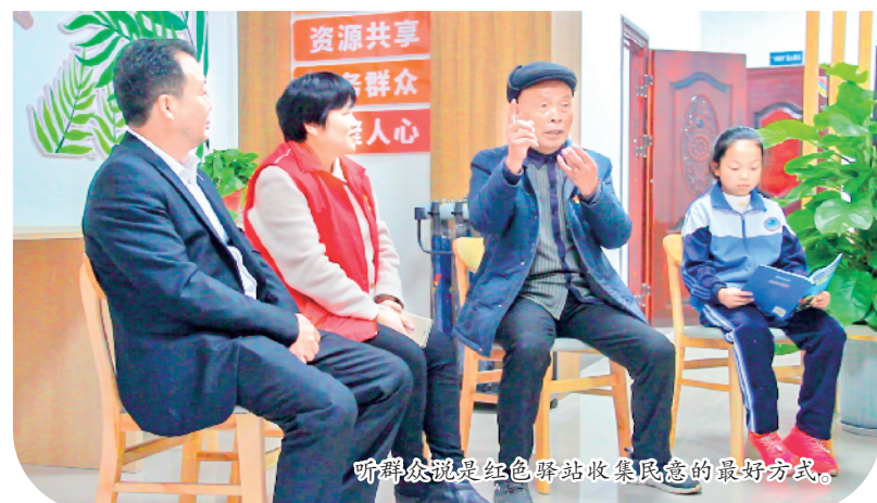
听群众说是红色驿站收集民意的最好方式。