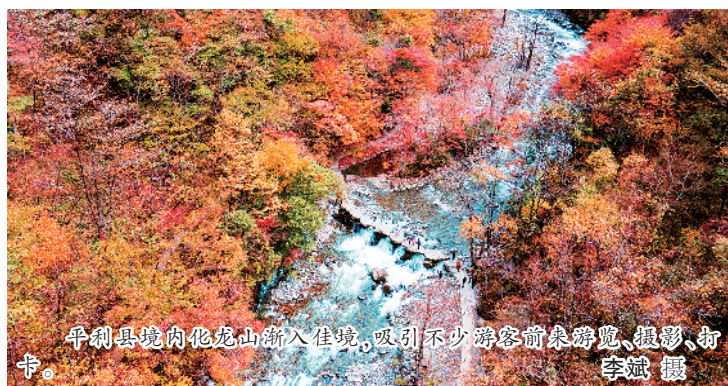
平利县境内化龙山新入佳境，吸引不少游客前来游览、摄影、打卡。