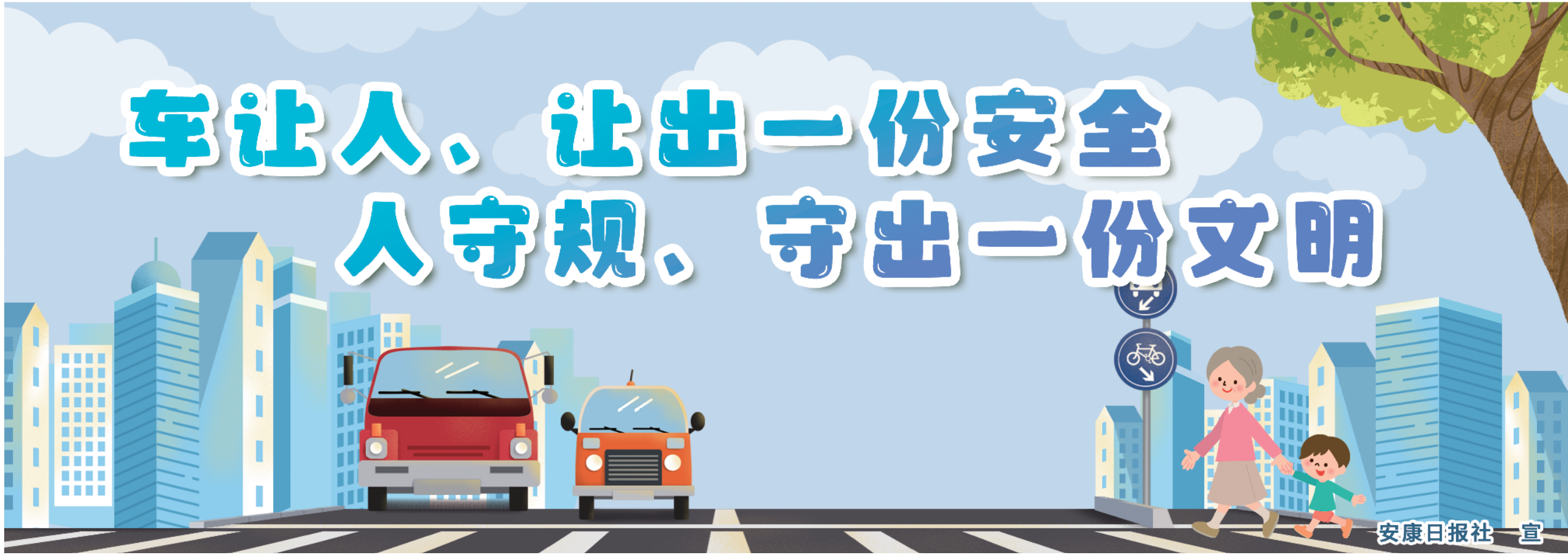
朱慧卿作