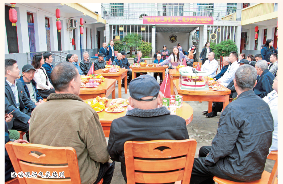
活动现场气氛热烈

为弘扬中华民族传统美德,营造尊老、爱老浓厚氛围,在10月22日重阳节即将来临之际,安康日报社开展“九九重阳 孝老爱亲”主题活动。本次活动由安康市关心下一代工作委员会、安康市妇女联合会、安康日报社主办,安康少年新闻学院、安康金州启慧文化传播有限公司承办。活动中的手势舞表演《中华孝道》、互动游戏《拍拍操》、分享重阳糕、茶艺表演及为老人奉茶等环节,让现场每个人感受到了浓浓的节日氛围。