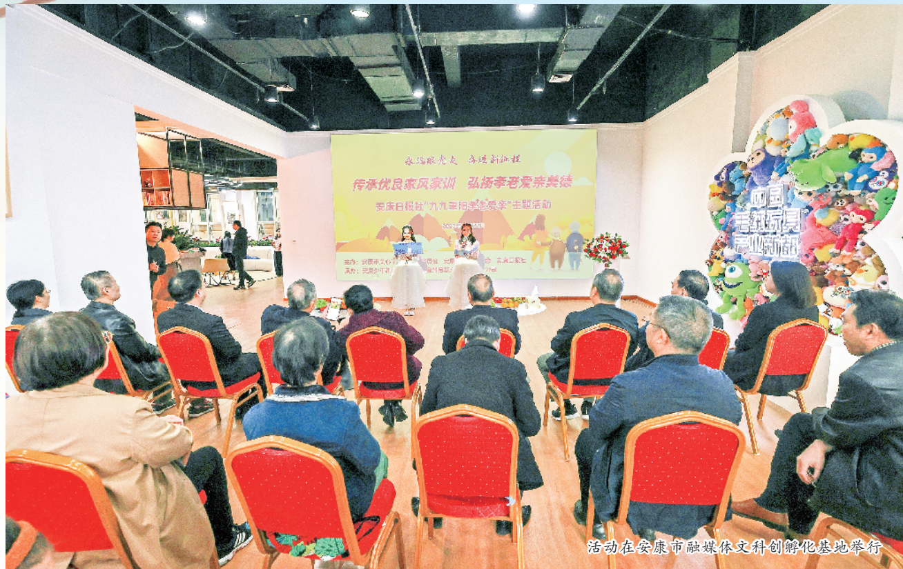
活动在安康市融媒体中心科创孵化基地举行