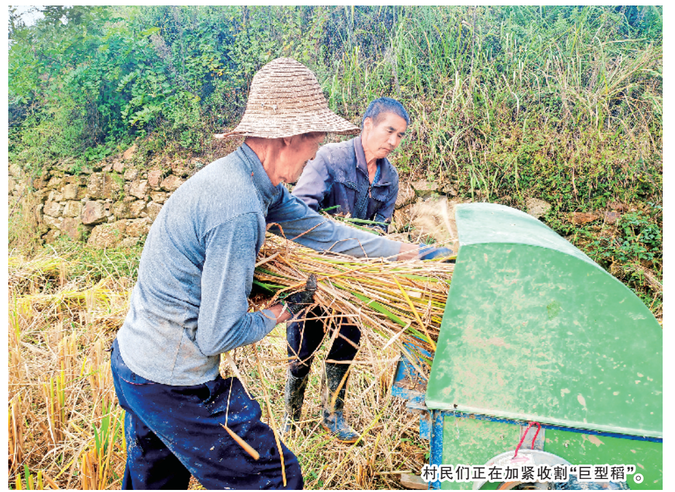
村民们正在加紧收割“巨型稻”。