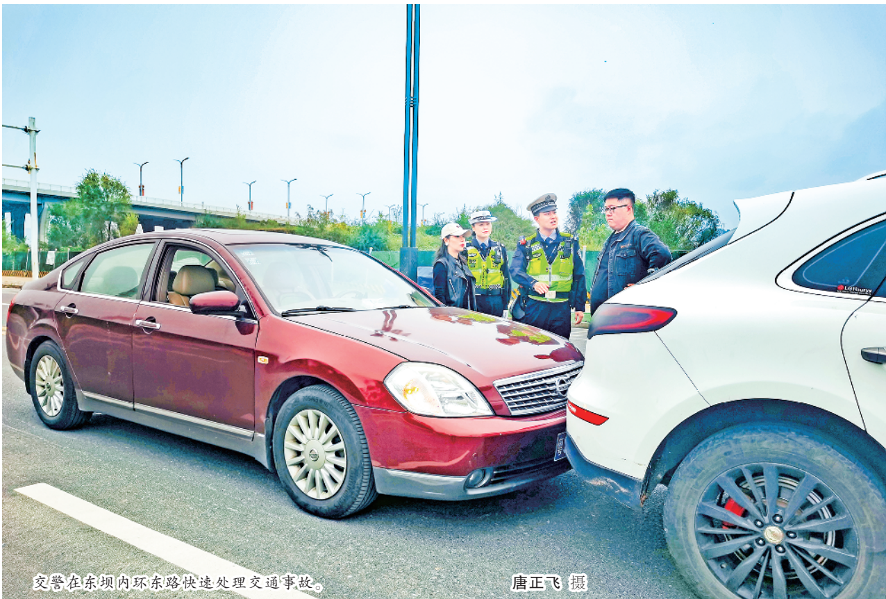
交警在东坝内环东路快速处理交通事故。