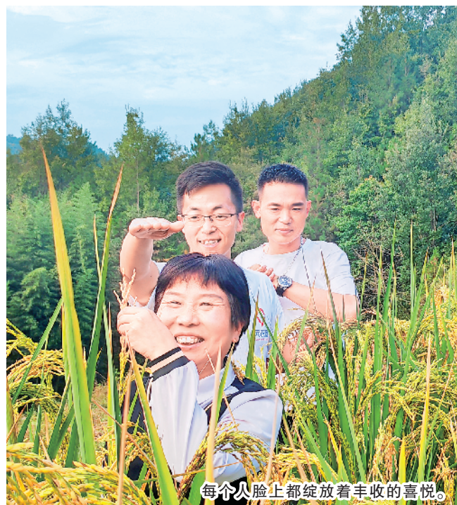
每个人脸上都绽放着丰收的喜悦。

平均亩产仅181公斤。1954年开始，我市先后引进水稻良种胜利籼、白马粘、川大一号等，高秆改良种逐渐代替了地方农家种，使水稻平均亩产达到217公斤。1976年开始，安康又先后引试11个杂交组合，带动了栽培技术的改革，使水稻产量稳步提升，近年来，随着现代化农业技术的引入，水利基础设施不断提升，使得水稻种植更加集约化、高效化，安康水稻种植面积常年稳定在50万亩以上，亩产达400余公斤，不仅满足了当地群众的粮食需求，还大量销往外地，甚至出口到国外，为安康经济的发展做出了重要贡献。尤其是近年来安康率先提出并研究的水稻轻简化直播技术取得示范成功，开启了陕南水稻轻简化栽培的新阶段。此次“巨型稻”在盘龙村的成功种植，对于提升粮食产量和保障粮食安全具有重要意义。