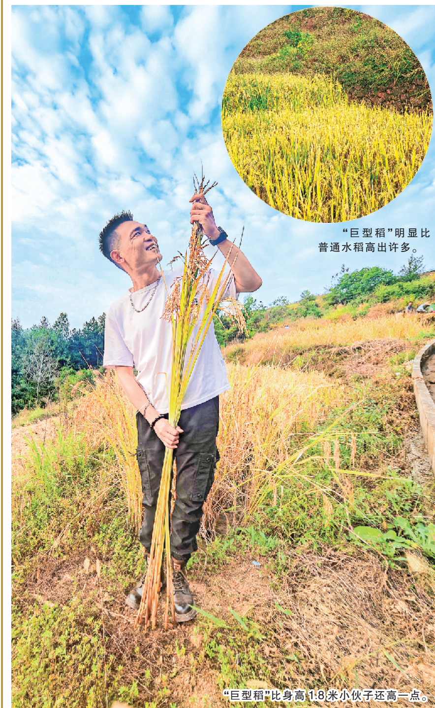
“巨型稻”明显比普通水稻高出许多。