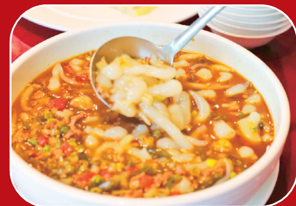
酸豇豆肉沫面鱼儿

面鱼是一道著名的安康传统小吃，酸豇豆肉沫面鱼儿别有一番风味。酸豇豆肉沫面鱼儿可热吃也可放凉吃，酸辣爽口。夏季特别适宜，可缓解夏季的烦躁，是夏季提升食欲的佳品。