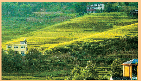
位于石泉县城关镇丝坝村的草池湾迎来秋收季，200亩有机水稻铺满一地“金黄”。