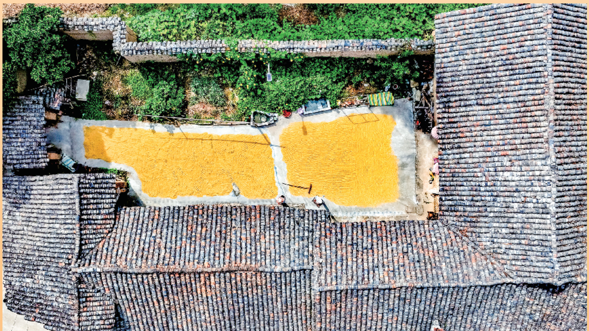
在汉阴县洞池镇青砖瓦的农家小院里，黄澄澄的稻谷铺在地上晾晒着，好一幅“晒秋”的风景画。