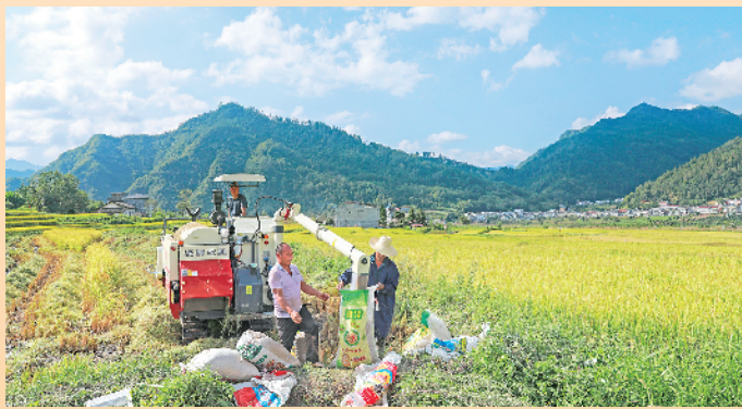
又是一年稻熟时，平利县洛河镇村民正在用收割机收割水稻。