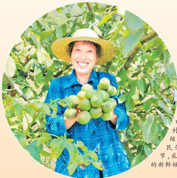
时下正值核桃采摘季，在汉阴县双河口镇斑竹园村的佳林千亩核桃园里，村民们正抢抓时节，采摘漫山遍野的新鲜核桃。