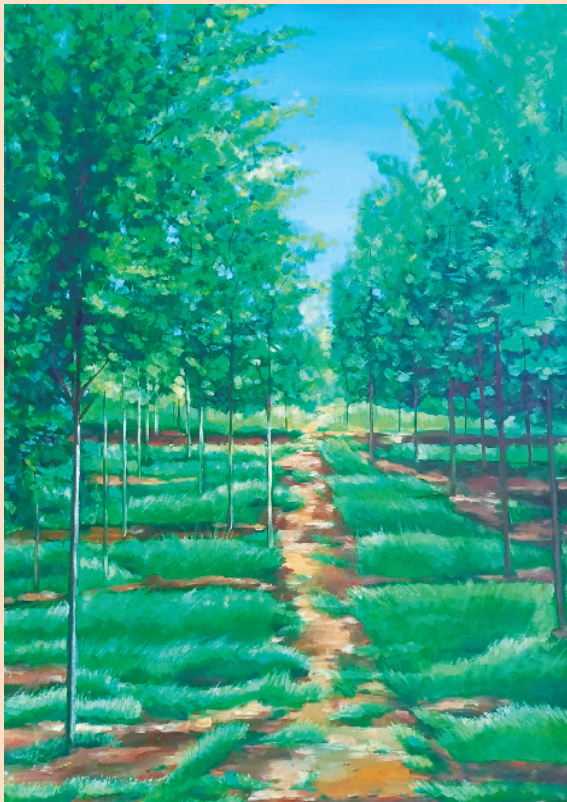
小树林(油画) 陈益鹏 作

作为教师,最大的优势就是有充足的时间来阅读。是阅读让我爱上写作,阅读让我的写作脱离幼稚肤浅,渐渐成熟,渐入佳境。