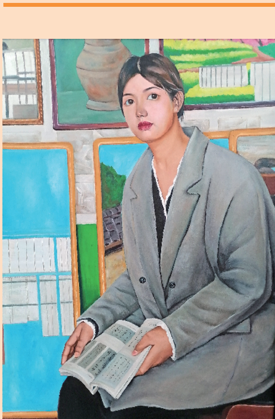
青年女教师(油画) 陈益鹏 作