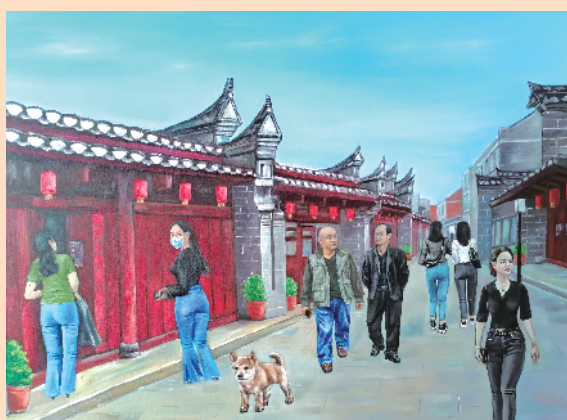
老街(油画) 陈益鹏 作