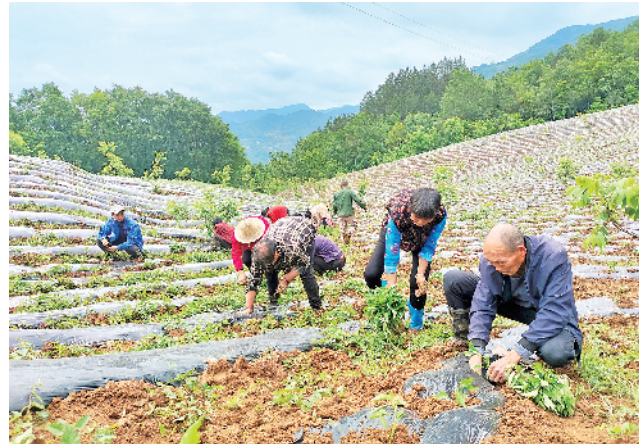
村民在铜钱关镇黄泥坪村辣椒种植基地移栽辣椒苗