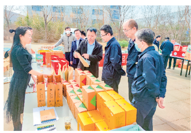
旬阳辣椒产品及其他农副产品走进中核集团成员单位展销