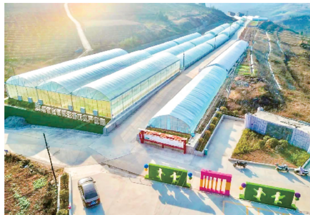
旬核生态农业产业园