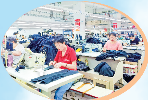
白河县益成服饰社区工厂工人正在赶制衣服。