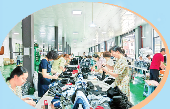
年产5000万双袜子生产线项目于2023年5月31日在茅坪镇建成投产。

2022年4月22日，安康市召开促进就业创业工作会议，白河县被市政府表彰为“就业创业先进县”。