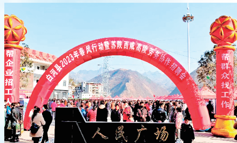
白河县2023年春风行动暨苏陕西成高陵劳务协作招聘会在县人民广场举行。