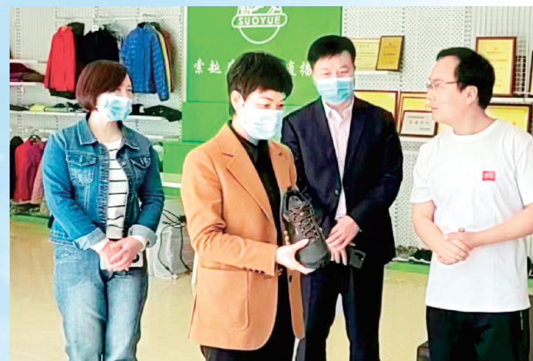
白河县长龚颖到社区工厂调研指导“四百工程”稳就业促增收工作。