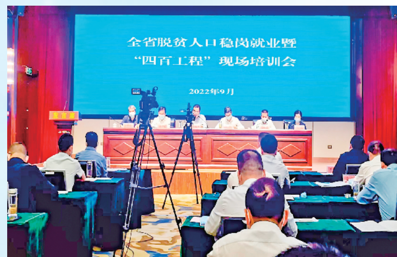
2022年9月29日至30日，全省脱贫人口稳岗就业暨“四百工程”现场培训会议在白河召开。