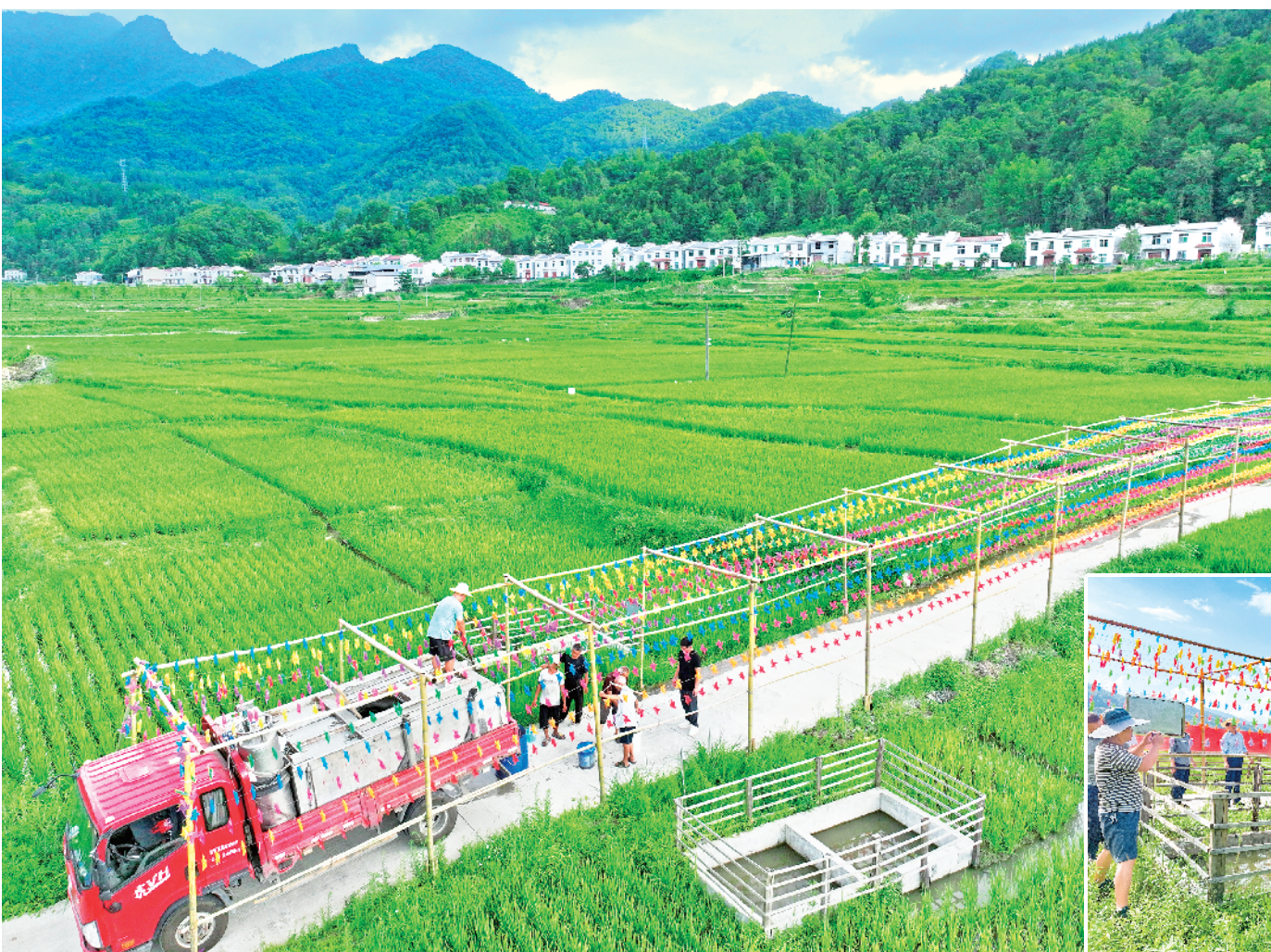
7月25日,平利县广佛镇松河村举行2023年稻鱼综合种养鱼苗投放启动仪式。活动现场,县畜牧中心渔业工作人员一边投放,一边讲解养殖技术和养殖要求。据了解,松河村2023年实施稻鱼养殖100余亩,投放鱼苗2000余斤。

储备乡土人才队伍,构筑“蓄水池”。引导人才“下沉”。从机关选派54名优秀干部担任驻村第一书记,选派优秀后备干部101名担任驻村工作队队员;整合人才资源。大力动员农村致富带头人、退休干部、历任村干部等参与村级发展,与村“两委”共同建强基层组织,推动基层治理工作;注重人才“引流”。大力引进急需型、复合型人才,出台一系列人才优惠政策,吸引返乡创业人才,推动“人才回乡、项目回引、资金回流”。通过公务员招录、事业单位公开招聘等方式,专项招引高层次人才、高校毕业生和专业技术型人才等进入基层服务。