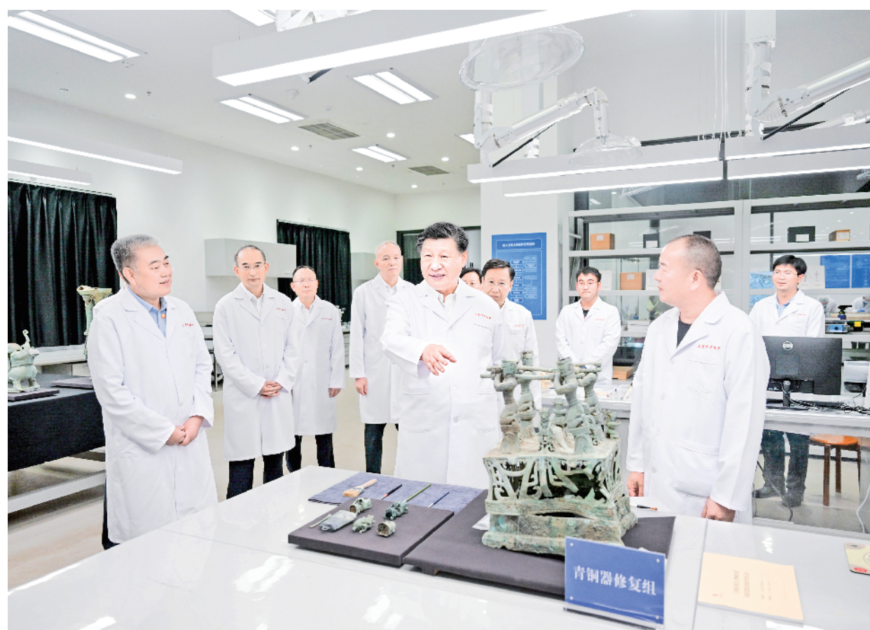
7月25日至27日，中共中央总书记、国家主席、中央军委主席习近平在四川考察。这是26日下午，习近平在位于德阳市广汉市的三星堆博物馆文物保护与修复馆，同现场工作人员亲切交流。

新华社四川成都/陕西汉中7月29日电 中共中央总书记、国家主席、中央军委主席习近平近日在四川考察时强调，全面学习贯彻党的二十大精神，要牢牢把握新时代新征程党的中心任务，牢牢把握中国现代化的科学内涵和本质要求，牢牢把握高质量发展这个首要任务，把贯彻新发展理念、构建新发展格局、促进共同富裕贯穿经济社会发展各方面全过程，深入推进发展方式、发展动力、发展领域、发展质量变革，开创我国高质量发展新局面。四川要进一步从全国大局把握自身的战略地位和战略使命，立足本地实际，明确发展