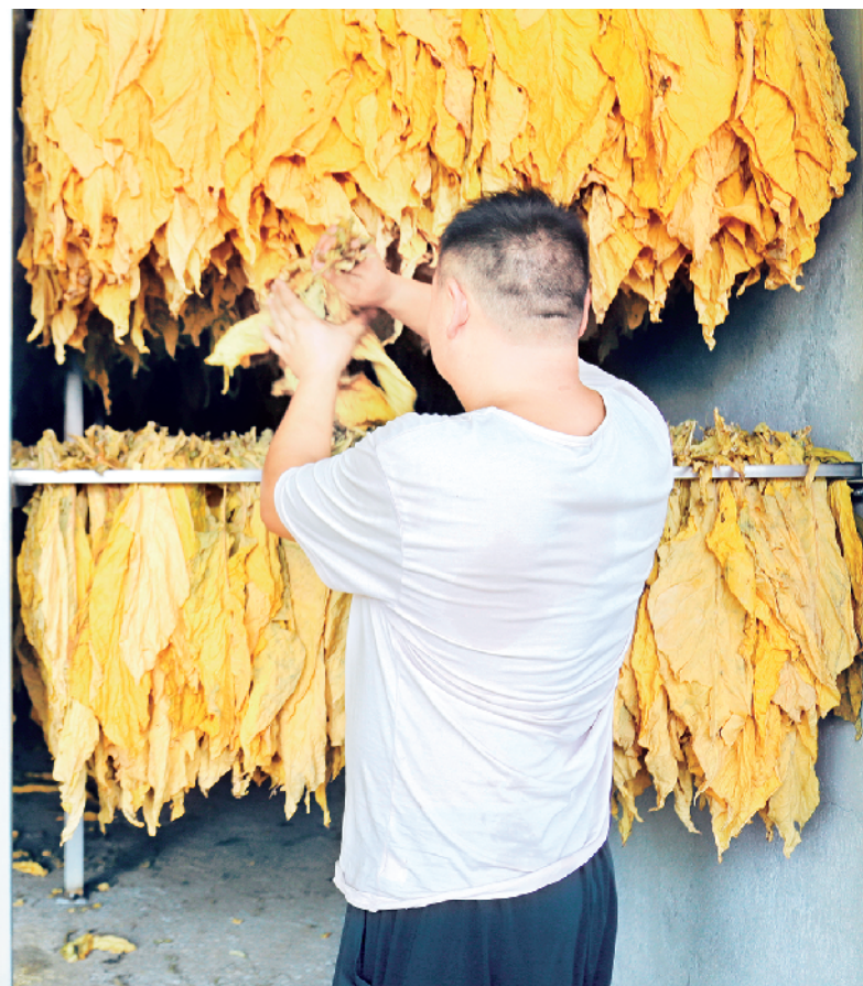
仲夏时节,正是烟叶采收、烘烤的关键时期。1月13日,笔者走进岚皋县城关镇联春村一组的烤烟种植基地,成片的烟叶郁郁葱葱,宽大的叶片随风摇曳,层层叠叠,成为一道别致的风景。烟地里,烤房旁,到处可见采收烟叶上棚、烘烤的忙碌身影,构成了一幅美好的丰收画卷。