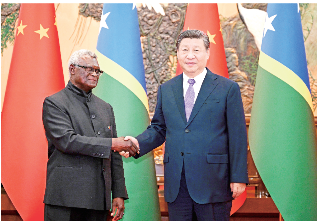
七月十日下午，国家主席习近平在北京人民大会堂会见所罗门群岛总理索加瓦雷。

新华社北京7月10日电（记者郑明达）国家主席习近平10日下午在人民大会堂会见来华进行正式访问的所罗门群岛总理索加瓦雷。双方共同宣布，中国和所罗门群岛正式建立新时代相互尊重、共同发展的全面战略伙伴关系。习近平指出，中国和所罗门群岛是彼此值得信赖的好朋友、可以依靠的好兄弟。建交以来，两国友好合作后来居上，走在了中国同太平洋岛国关系前列，成为不同大小国家和发展中国家团结合作、携手发展的典范。事实证明，中所建交顺应时代潮流，契合国际大势，符合两国人民根本利益，是正确选择。中方愿同所方加强战略沟通，深化各领域合作，推动两国全面战略伙伴关系行稳致远、好上加好，更好造福两国人民。习近平强调，中方高度赞赏所方坚定奉行一个中国原则，支持所方维护主权、安全、发展利益，支持所方自主选择的发展道路。中方坚持把好自己的事情办好，始终做世界和平的建设者、全球发展的贡献者、国际秩序的维护者，愿同所方分享中国式现代化带来的发展机遇，加强共建“一带一路”同所罗门群岛“2035发展战略”对接，拓展各领域务实合作，扩大进口所方优势产品，帮助所方实现发展振兴和长治久安。中方支持更多中国企业赴所投资兴业，将继续向所方提供不附加政治条件的经济技术援助。双方要扩大医疗、教育等领域友好交流。中方支持所方举办第十七届太平洋运动会。习近平指出，中国的太平洋岛国政策秉持“四个充分尊重”：一是充分尊重岛国主权和独立，坚持大小国家一律平等；二是充分尊重岛国意愿，坚持共商、共建、共享、共赢；三是充分尊重岛国民族文化传统，坚持和而不同、美美与共；四是充分尊重岛国联合国宗旨，支持岛国落实《蓝色太平洋2050战略》，为建设一个和平、和谐、安全、包容、繁荣的蓝色太平洋作出贡献。中方理解太平洋岛国面临气候变化严峻挑战，愿同岛国加强气象服务、防灾减灾、清洁能源等领域交流合作，助力岛国落实联合国2030年可持续发展议程。（下转四版）