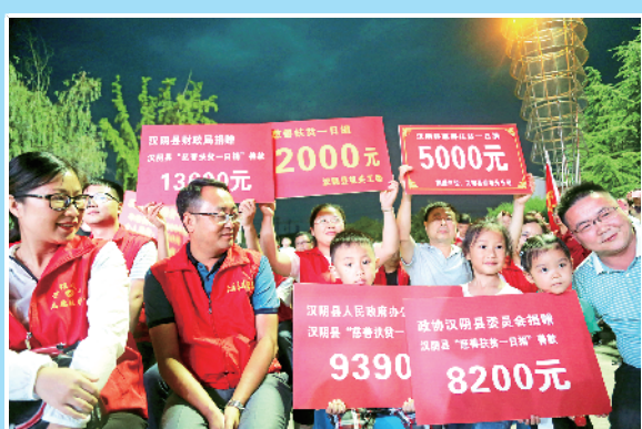
汉阴县举行慈善晚会。