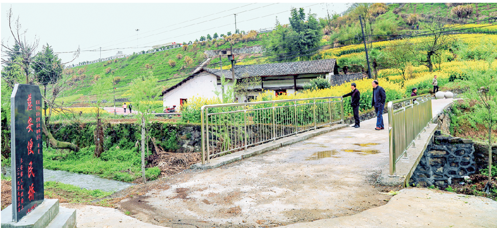
平利县长安镇新建慈善便民桥惠及百姓。

如今，它已经被群众们广泛传诵，如同2800多座爱心桥一样温暖着秦巴山区的老百姓。