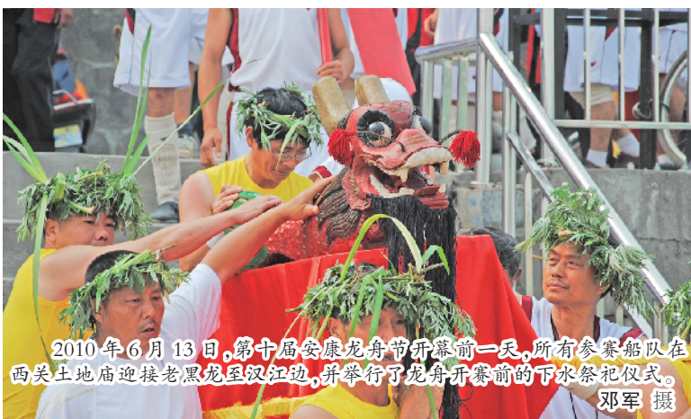
2010年6月13日，第十届安康龙舟节开幕前一天，所有参赛船队在西关土地庙迎接老龙头红江，并举行了龙舟开赛前的下水祭祀仪式。