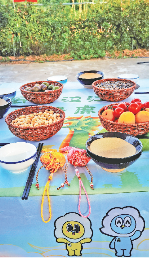
2023年“千人汉江排子席”试菜现场。