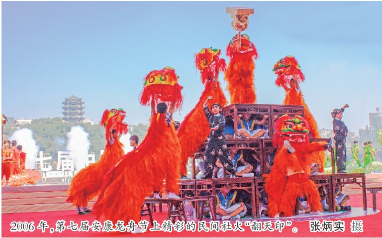
2006年，第七届安康龙舟节上精彩的民间社火“翻天印”。

讲座在掌声中开始，在掌声中结束。在场听众意犹未尽，久久不愿离去。徐右冰先生表示，他一定会再来。