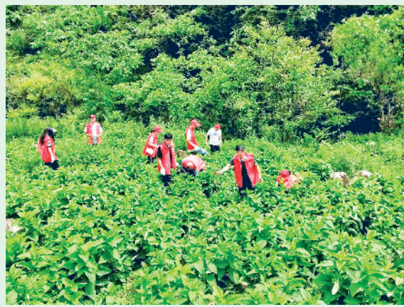
青年志愿者服务中药材产业管护