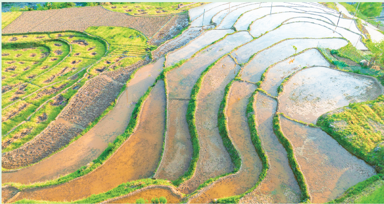
青台村万亩“定制”水稻园