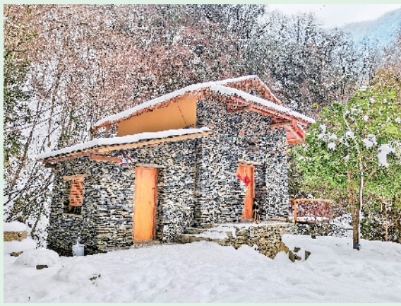
鱼坪村田园综合体项目