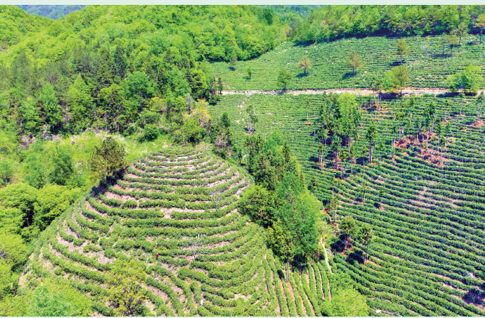
向阳村发展生态茶产业500余亩